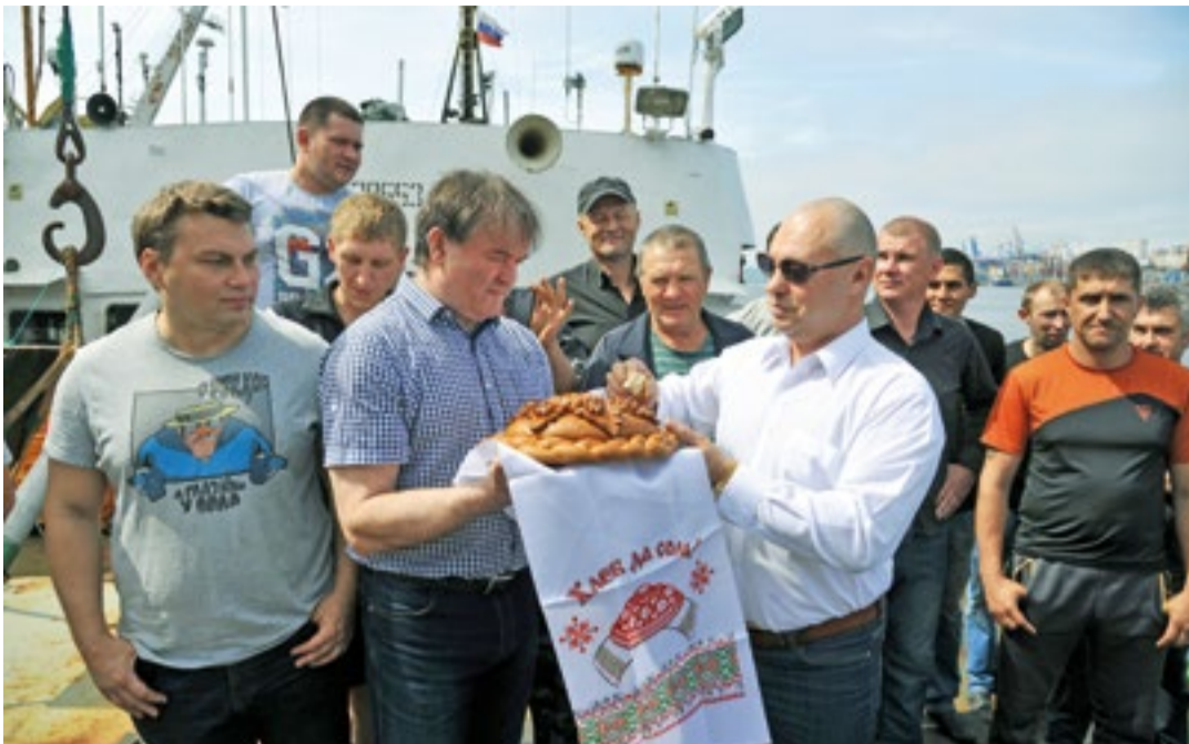
Праздничный каравай и теплые слова поздравлений к прибытию траулера «Таманго» разбавили портовые будни

В общей сложности к настоящему моменту лимиты «Антея» по крабам освоены почти на 70%. По словам гендиректора компании, до конца года основной упор будет сделан на вылов камчатского краба, который открывается с сентября – это около 735 тонн. Еще чуть более 300 тонн краба-стригуна опилю суда компании будут добывать в Охотском море.