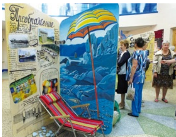
Основе праздника – промыслу – внутри киноконцертного комплекса посвятили познавательные стенды

Взаимные поздравления слышны уже в четверг, пока