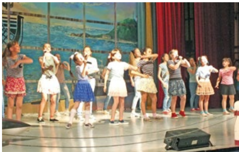
Для гостей праздничного мероприятия выступили местные и краевые творческие объединения от мала до велика