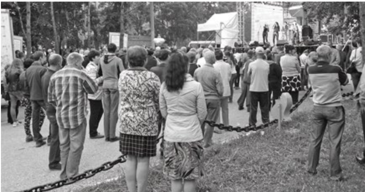
На празднике Дня рыбака в Преображении царствует чувство всеобщей причастности

предприятие готовит для поселка развлекательную программу на все выходные. В это время семьи планируют совместные выезды на природу, будущие участники торжеств гладят рубашки, а их дети гоняют мяч на стадионе такого размера и вида, каких никак не ожидаешь от глублинки.