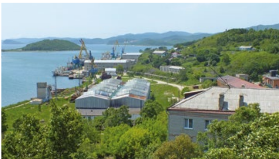
Преображение расположилось между морем и заповедными лесами Лазовского района Приморья