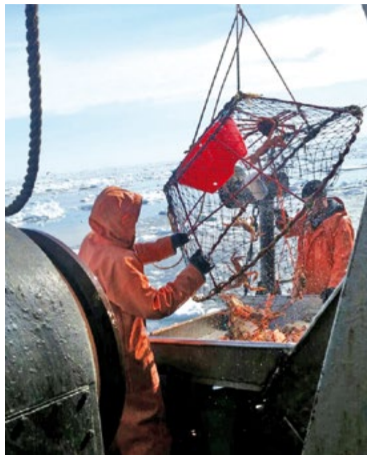
Добыча краба, несмотря на относительно небольшие объемы, отличается авральным режимом работы