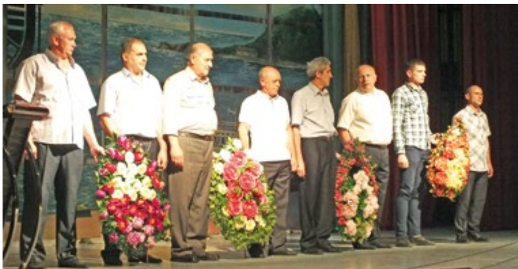
Традиционно частью торжественного вечера стало возложение венков к мемориалам в честь рыбаков, не вернувшихся с промысла и полей битв Великой Отечественной войны