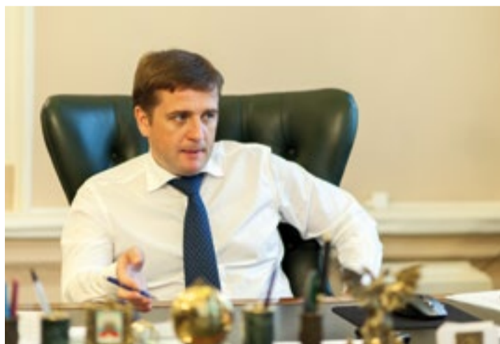
Илья ШЕСТАКОВ, руководитель Росрыболовства

– Что касается заморозки на судах – это изначально было позицией правительства: разрешается только доставка уловов в свежем, живом или охлажденном виде. В рамках «Прямой линии с президентом», когда в ответ на вопрос, в том числе и по «прибрежке», президентом озвучивалась позиция, тоже говорилось только о свежем, живом или охлажденном виде. Поэтому, действительно, полемика была,