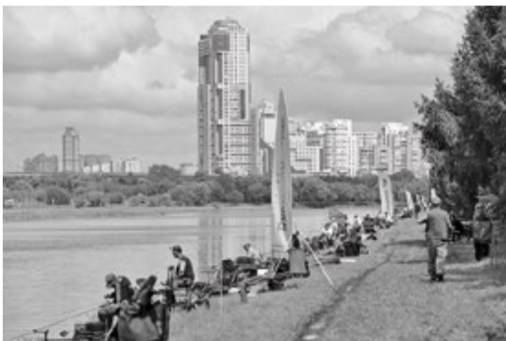
В Крылатском активно ловили рыбу

Участников фестиваля приветствовал почетный гость мероприятия – лидер ЛДПР Владимир ЖИРИНОВСКИЙ. Известный политик отметил, что рыбалка – это и спорт, и досуг,