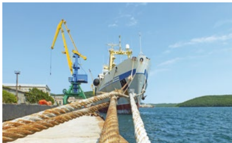
БМТР «Бухта Преображения» у причала после успешного промысла