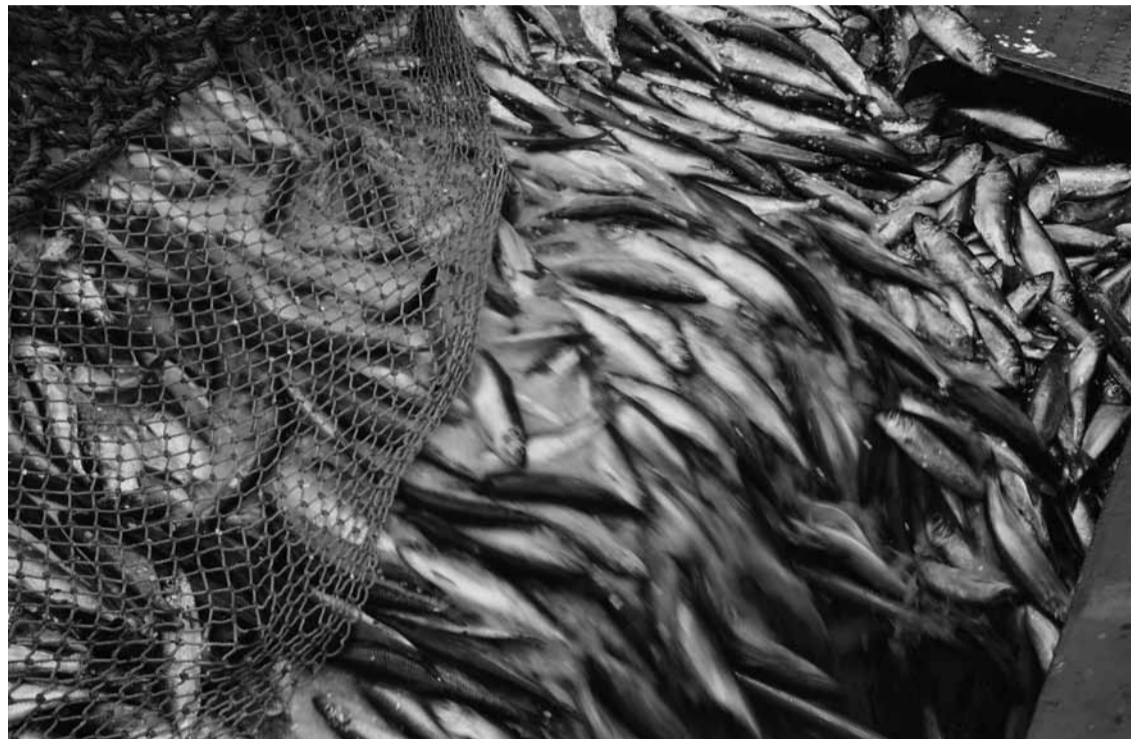
Олюторская сельдь – самая крупная и с высоким процентом полезной жирности – продукт особенно ценный

Кстати, для земляков-камчатцев ПАО «Океанрыбфлот» реализует сельдь по льготным ценам: уже несколько лет по договоренности с краевым правительством рыбодобывающая компания снабжает жителей полуострова рыбопродукцией по социальной программе, со скидкой 20% от среднерыночной стоимости. Причем сельди привезено ровно столько, сколько нужно, чтобы закрыть потребности Камчатки. С транспортного судна «Бухта Русская», пришедшего из района промысла, в начале декабря было отгружено на камчатский берег около 300 тонн самой крупной сельди, произведенной на судовых заводах компании прямо в районе промысла.