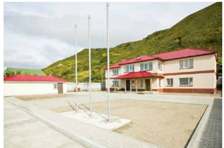
База парусного спорта в Невельске

ка одаренных детей, талантливой молодежи.