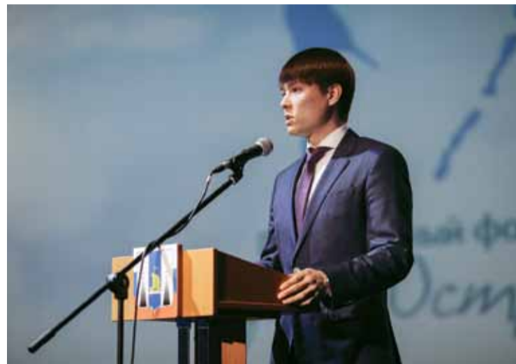
Александр КАН на открытии фонда «Родные острова»

Сейчас в Сахалинской области активно развивается профессиональный спорт – баскетбол, волейбол, хоккей, футбол. Но закономерно вставал вопрос: где разместить приезжих спортсменов? И в целом –