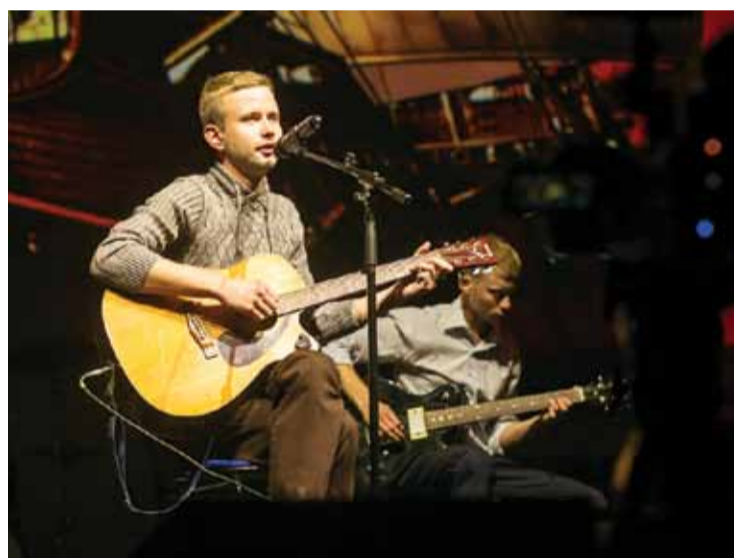
Арт-фестиваль «Заяви о себе»

Мы ведь занимаемся рыбным промыслом – пользуемся государственным ресурсом. Льготная налоговая база, единый сельхозналог, – тоже сейчас приемлемы для рыбаков.