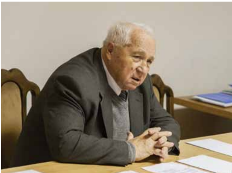
Василий ГЛУЩЕНКО, председатель правления Росрыбхоза