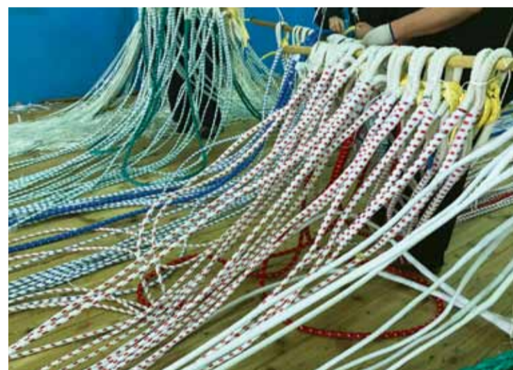
Потребность в облегченных тралах начали ощущать и на Дальнем Востоке