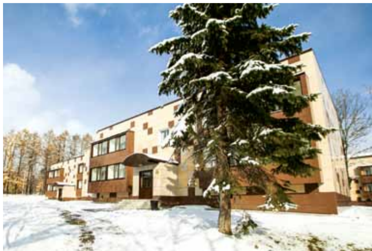
Жилые корпуса спортивного комплекса «Восток»

– Приоритеты работы фонда – не только содействие спорту, но и поддерж-