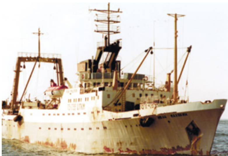
▲ БМРТ «Иван Малякин»