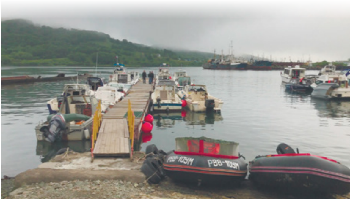
▲ С этого пирса катер ушел в свой последний поход

Экипаж катера не поставил в известность о своем походе ни одну из государственных служб, которые регламентируют плавание в Авачинской губе и на подходах к ней. Хотя эта обязанность распространяется и на маломерные лодки, и на катера.