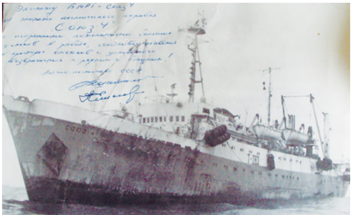
▲ БМРТ «Союз-4»

– это дважды лучшие показатели года среди экипажей в Дальрыбе и один раз в Министерстве рыбного хозяйства СССР! На мои последние два рейса на БМРТ «Иван Малякин» пришлось ремонт судна в Перу и работа на промысле хека в Советско-американской компании возле берегов США и Канады.