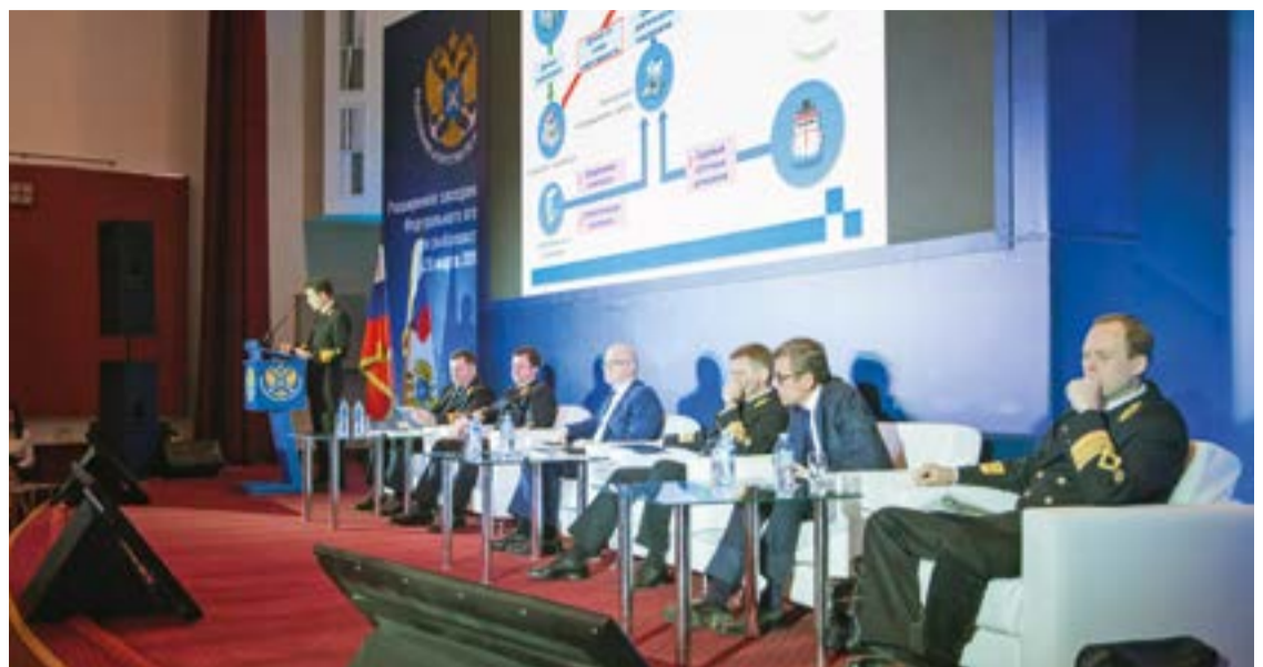
На коллегии Росрыболовства начальник ЦСМС обозначил конечной целью развития ОСМ – создание межведомственной информационно-аналитической системы «Рыболовство»

– Это, наверное, идеальная ситуация, если каждый пользователь будет работать через портал ОСМ, но это не будет обязательной. Мы делаем портал именно для того, чтобы рыбакам было удобней и проще. Мы разговаривали с ними на семинарах, и могу сказать, что они видят большие преимущества такой работы. Отрасль должна это почувствовать, увидеть, и рыба-