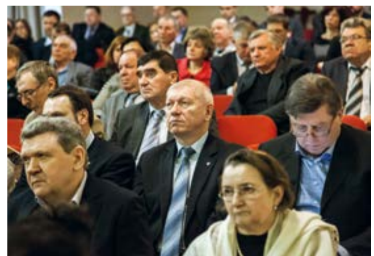
В 2017 г. предприятия – члены Ассоциации «Росрыбхоз» обеспечили 67,2% выращенной в стране рыбы