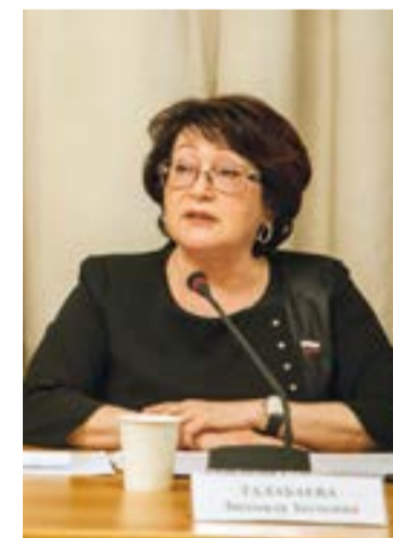
Член Совета Федерации Людмила ТАЛАБАЕВА

Не менее важным для бизнеса является возможность использования рыбопромысловых участков не только для рыболовства, но и для разведения гидробионтов. В этом заинтересованы пользователи и морских акваторий, и пресноводных водоемов, в частности многочисленных озер Урала и Сибири.