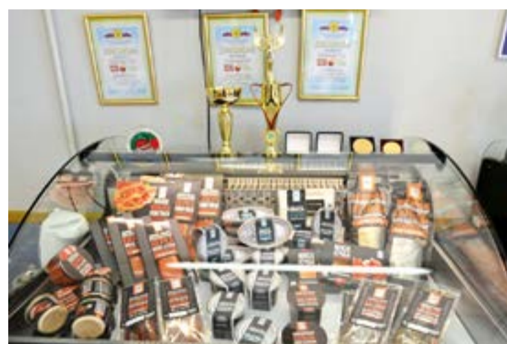
«Русская Рыбная Фактория» активно занимается развитием бренда и продвижением своей продукции