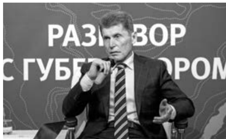
Губернатор Сахалинской области Олег КОЖЕМЯКО

«Мы будем высказываться против постановки РУЗов на территории Сахалина», – отметил Олег Кожемяко. При этом он напомнил, что у представителей областной администрации в комиссии по анадромным не «контрольный пакет», а протокол утвержд-