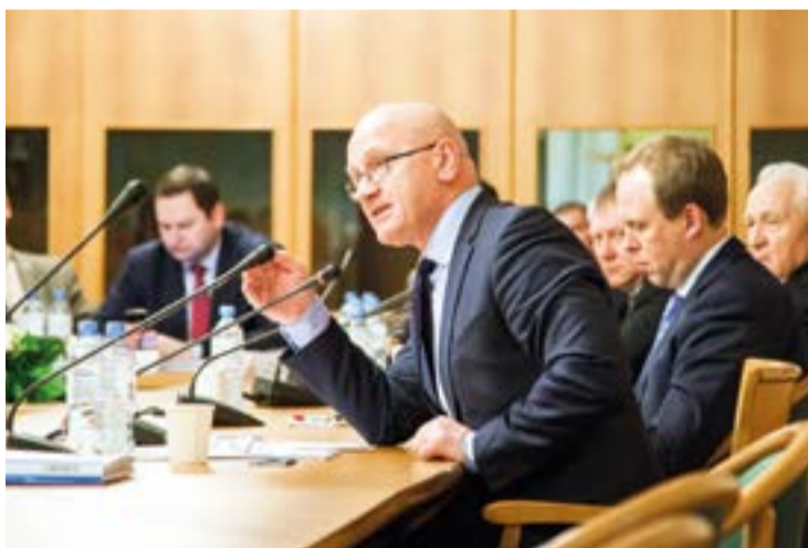
Член Комитета Госдумы по природным ресурсам Константин СЛЫЩЕНКО