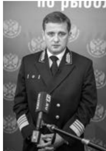
Руководитель Росрыболовства Илья ШЕСТАКОВ

Глава Росрыболовства заявил, что в случае введения аукционов на покупателей квот, возможно, все равно будут возлагаться обязанности по строительству новых судов-краболо-