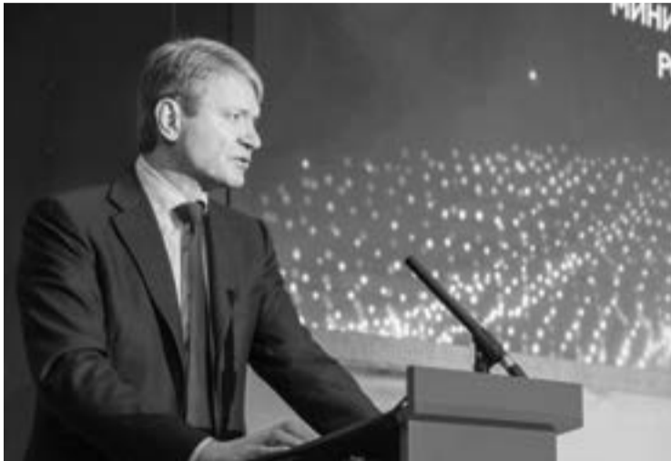
Министр сельского хозяйства Александр ТКАЧЕВ