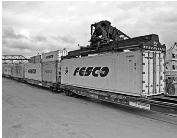
Собственный подвижной состав «Дальрефтранса» – 460 специализированных платформ и 38 дизель-генераторных вагонов

С июля будет запущен дополнительный поезд на Москву: отправления будут вы-