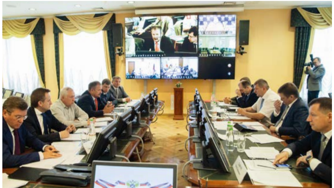
Внеочередное заседание Общественного совета

Оживленная дискуссия развернулась и вокруг проблемных вопросов, связанных с введением с 1 июля обязательной электронной ветсертификации уловов ВБР. Представители рыбац-