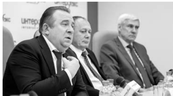
Президент ОСК Алексей РАХМАНОВ

Между тем в письме ОСК в Росрыболовство говорится, что отказ от реализации этих проектов «поставит верфь в критическое положение, оставив ее без заказов в среднесрочной перспективе» и с рядом недостроенных судов на стапелях. Другие предприятия в соста-