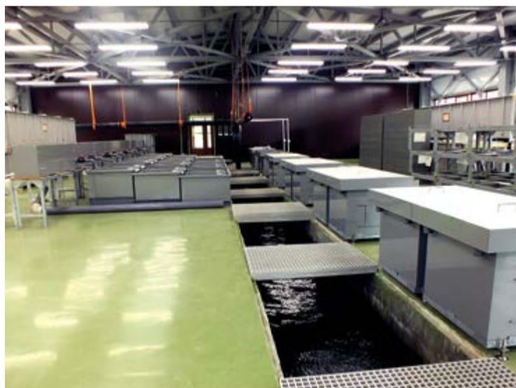
Через 3-4 года рыбный завод на озере Лагунное должен выйти на проектную мощность в 20 млн мальков лососевых в год