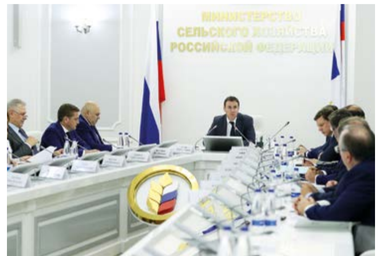
Дмитрий ПАТРУШЕВ провел первую встречу с рыбаками

На встрече с министром также обсуждались вопросы