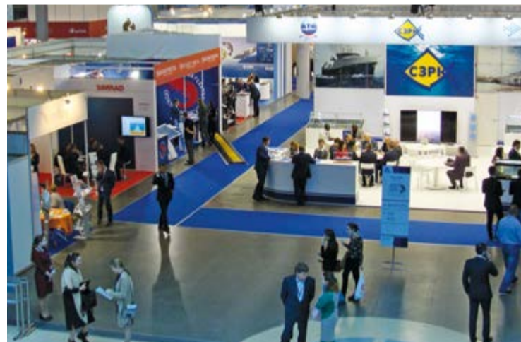
В 2017 г. Санкт-Петербург вернулся к проведению международной рыбной выставки

Еще в рамках деловой программы у нас запланированы презентации стран-участниц выставки. Одни из них хотят просто представить свою продукцию на российском рынке, другие – несколько сменить позиционирование, например,