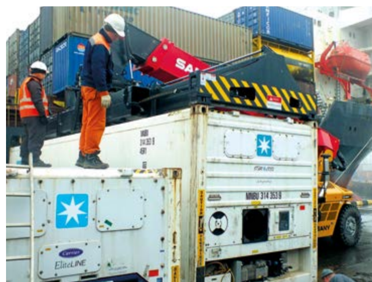
Совместно с партнерами Южно-Курильский рыбокомбинат реализует проект в сфере логистики

циальная программа, предусматривающая строительство еще как минимум трех заводов через определенный промежуток времени. Изыскания на водоемах показали, что силы пока нужно сосредоточить именно на озере Лагунное. «Завод строится с расчетом на очень большие производственные мощности, оснащен по последнему сло-