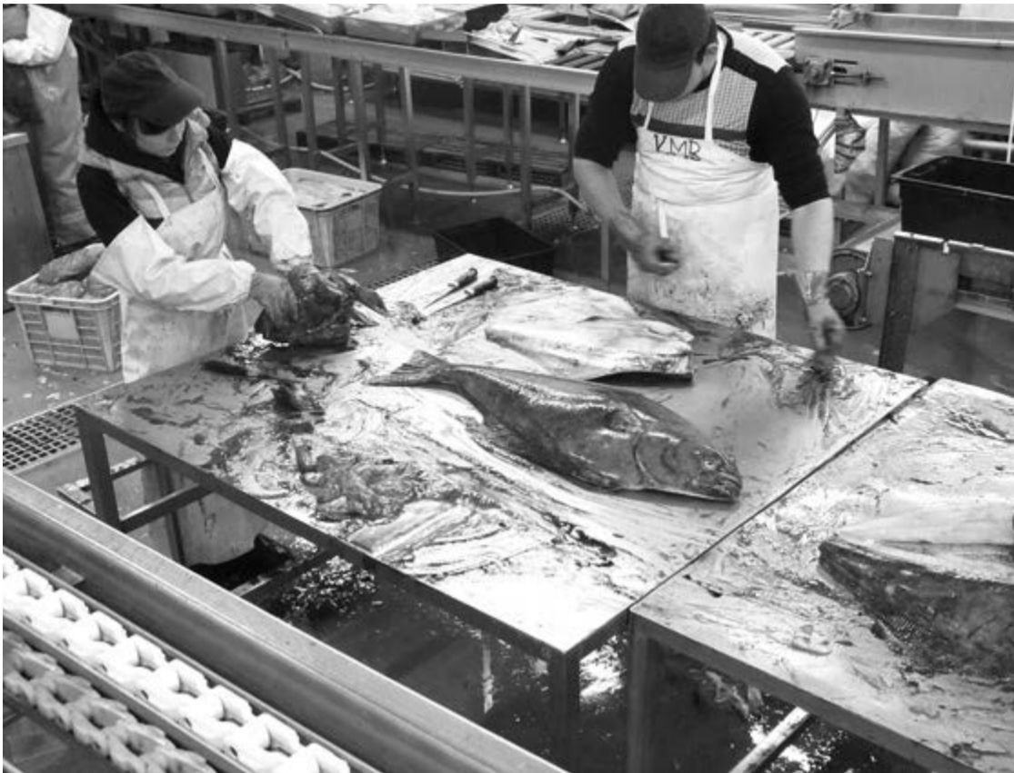
Разделка палтуса на филе