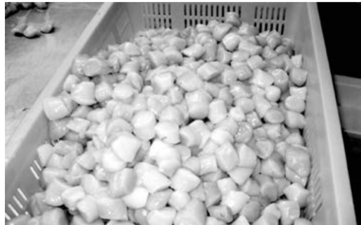
Пока «Меркурий» не видит не только гребешок, но и остальные продукты марикультуры