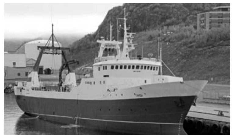
К траулерам «Рыболовецкой компании «Вирма»» добавятся два ярусолова российской постройки