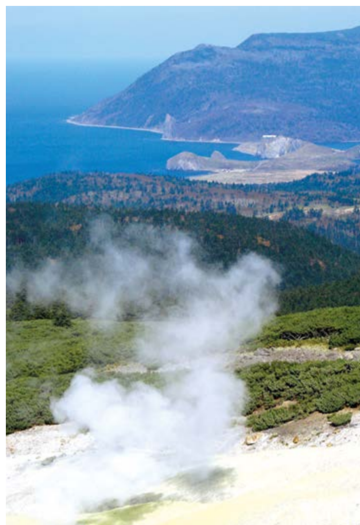
Озеро Лагунное со стороны вулкана Менделеева, Кунашир

Сохранение естественно-воспроизводства лососей – также один из приоритетов. «Рыбоводство – это не только строительство рыбного завода и мероприятия по воспроизводству молоди. Это и охрана нерестилиц, протоки, соединяющей море и озеро, это мелиоративные работы, борьба с браконьерством. Мы четыре года охраняем озеро