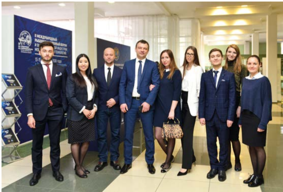
Команда Expo Solutions Group

Удалось выстроить полный цикл для продвижения бизнеса наших клиентов, которые заинтересованы в присутствии на выставке. На основе информации о продукции компаний, трендах и ценах на мировых рынках мы подбираем подходящую выставочную площадку именно для этого клиента, показываем целесообразность выхода на определенные рынки с тем или иным товаром, разрабатываем концепцию участия, дизайн стенда, а также мультимедийный контент. Создание концепции – это именно то звено, которого раньше не хватало в этой цепочке, которое отличает нас от других выставочных операторов. Не скажу, что у нас