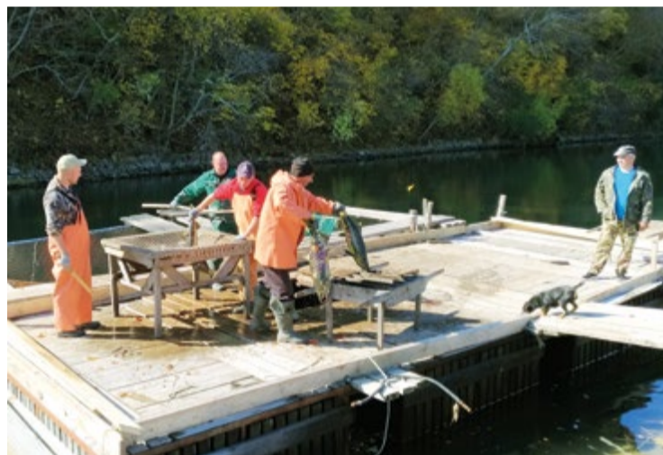
Рыбоводы завода «Вербное» отбирают производителей