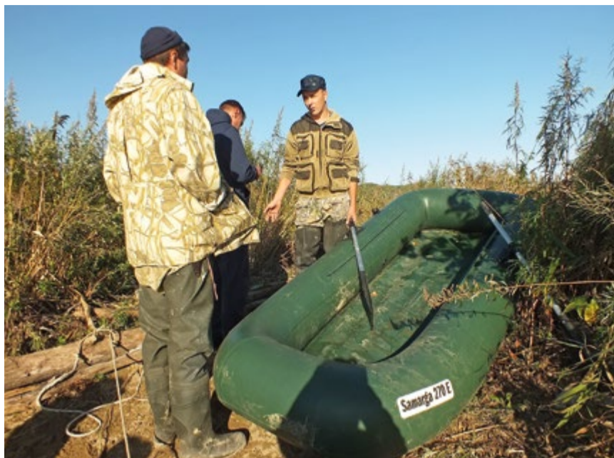
«Мимо проплывал, сеть не моя», – частая история на нерестовых реках