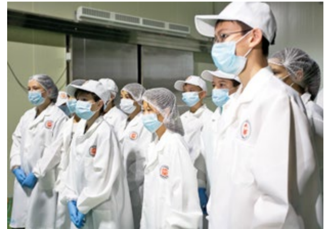
Рыбаки надеются, что кое-кто из этих ребят придет работать на производство

Школьники сахалинского Невельска побывали на береговом предприятии по переработке морепродуктов. Ребята не только расширили кругозор, но и узнали о перспективах работы в отрасли.