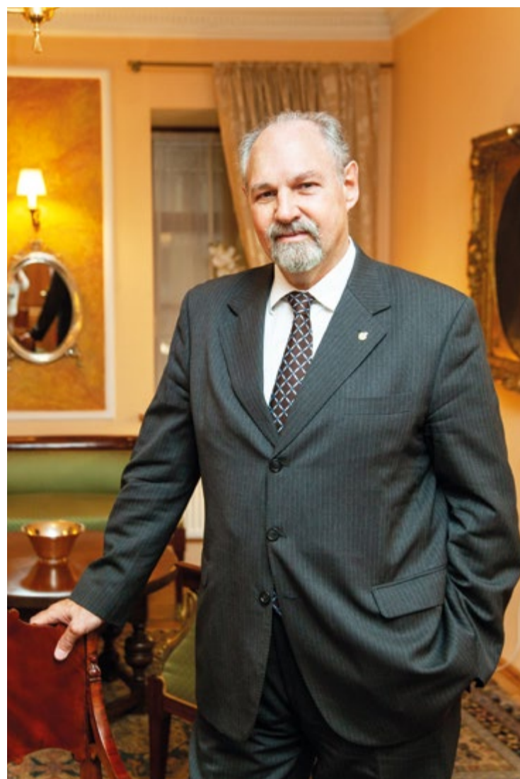
Чрезвычайный и Полномочный Посол Аргентинской Республики в Российской Федерации Рикардо Эрнесто ЛАГОРИО

Р. Лагорио: Я посетил четыре матча чемпионата мира по футболу, но национальная сборная не показала ту игру,