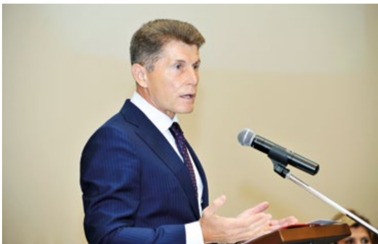
Олег КОЖЕМЯКО, врио губернатора Приморского края