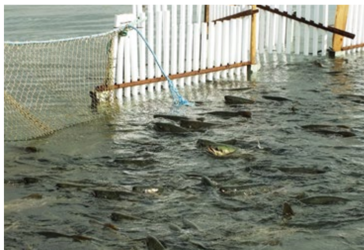
У РУЗа «Лидовского» завода вода «кипит» от напирания кеты

жуют, но до рукоприкладства дело не доходит».