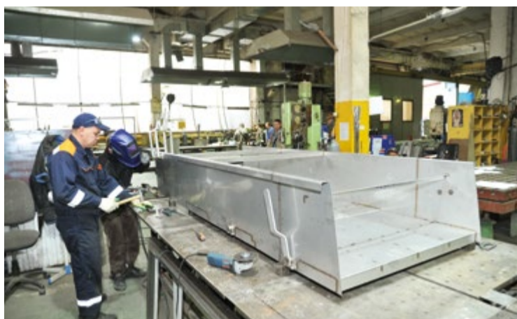
Свой юбилей «Технологическое оборудование» отмечает ударным трудом

Пять лет назад новым для компании технологическим вызовом была проблема переработки рыбных отходов и переход к созданию береговых рыбоперерабатывающих комплексов замкнутого типа. Сегодня это уже повседневная работа, отработанные решения, которые продолжают внедряться по всему Дальнему