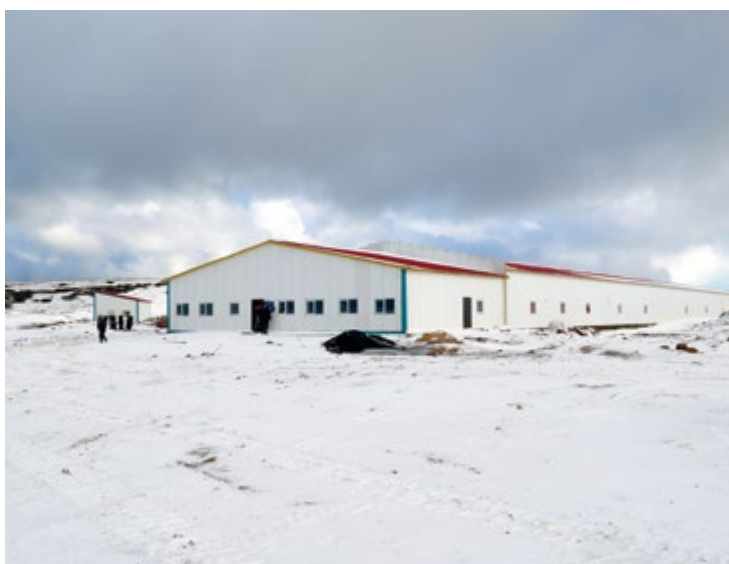
Средства в строительство завода инвестирует рыбодобывающая компания «Гранис», общий объем капиталовложений составит более 440 млн рублей