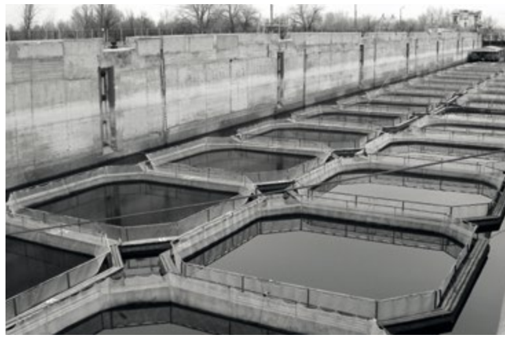
Только за 2017 г. астраханские рыбоводы вырастили 21 тыс. тонн товарной рыбы

Ноу-хау «Нашей кухни» – технология производства рыбного фарша, позволяющая удалять даже мелкие кости. «Сей-