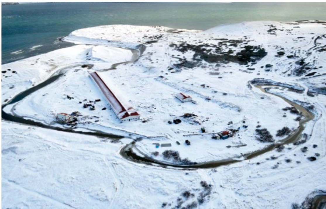
Лососевый рыбноводный завод «Савушкина» по своей мощности должен стать одним из крупнейших ЛРЗ на Дальнем Востоке