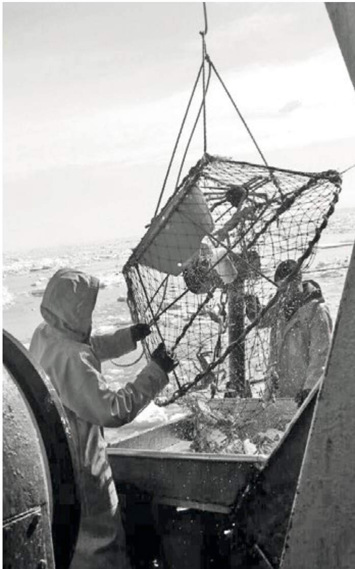
Основное направление деятельности холдинга «Антей» – добыча крабов

– Конечно, если посмотреть перечень стран – участниц промысла, то список их ограничен. В этом году к клякачовой экспедиции под-