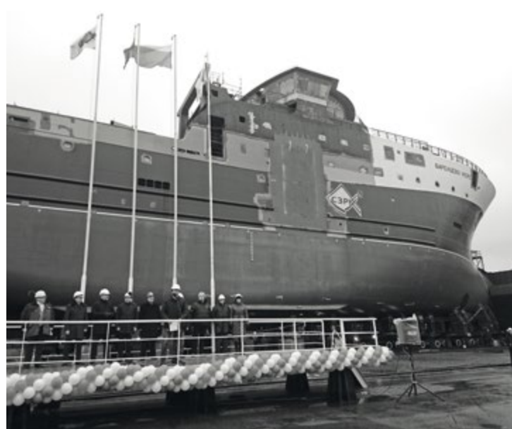
«Баренцево море» – первый в новейшей истории крупнотоннажный траулер, построенный в России