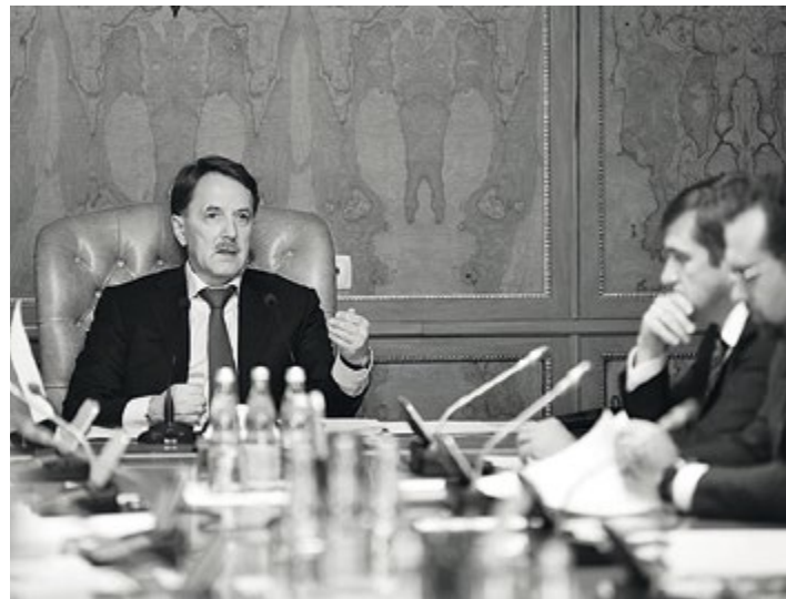
Вице-премьер Алексей ГОРДЕЕВ

Льготы в виде налогового вычета в размере 85% будут применяться в трех случаях. Во-первых, при производстве продукции на судах, находящихся в собственности компании либо в тайм-чартере. Во-вторых, при прибрежном рыболовстве, когда уловы поставляются на берег в живом, свежем или охлажденном виде – для дальнейшей реализации на внутреннем рынке или загрузки перерабатывающих предприятий. И в-третьих, в течение пяти лет после по-