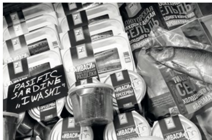
Продукция из сардины-иваси под брендом «Русской рыбной фактории» пользуется спросом не только на российском рынке

– Да, такая возможность рассматривается. Как я уже упомянул, двойная логистика. Поэтому, разместив производство ближе к местам промысла, мы сможем сократить издержки. Так что строительство