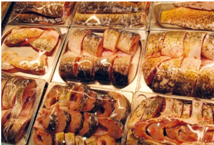
Свежая разделанная рыба с успехом заменяет живую в магазинах Астрахани

частиковой рыбы: толстолобика, судака, щуки, воблы, сома, сазана, леща. Комплекс включает несколько участков: икорный, балычное производство,