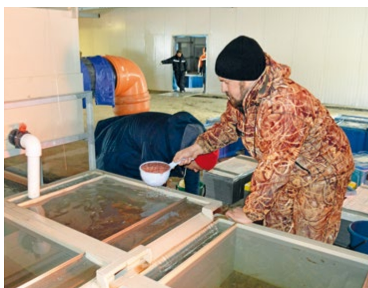
Более 70% работающего населения Северо-Курильского городского округа трудятся в рыбной отрасли

«Технологические тонкости для Парамушира надо нащупывать самим, на ходу, – считает он. – И ЛРЗ «Савушкина» является первооткрывателем рыбоводства