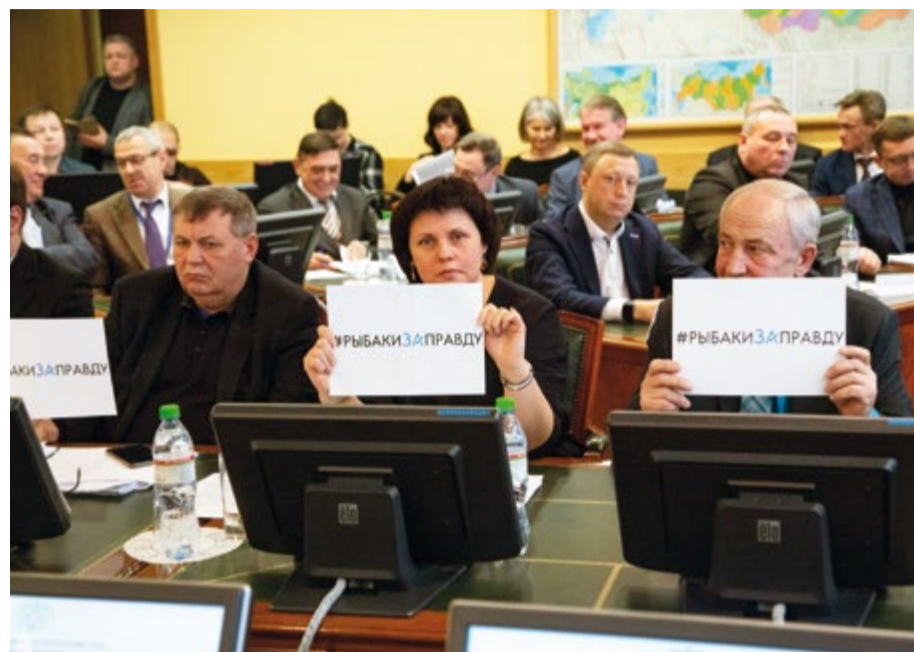
Акция поддержки продолжится в соцсетях под лозунгом #рыбакизаправду

Он предложил Общественному совету привлечь в качестве независимого арбитра третью сторону и направить в Счетную палату обращение об анализе эффективности деятельности федеральных органов исполнительной власти по контролю за рыболовством и сохранением ВБР, в том числе финансирования таких мероприятий из бюджета.