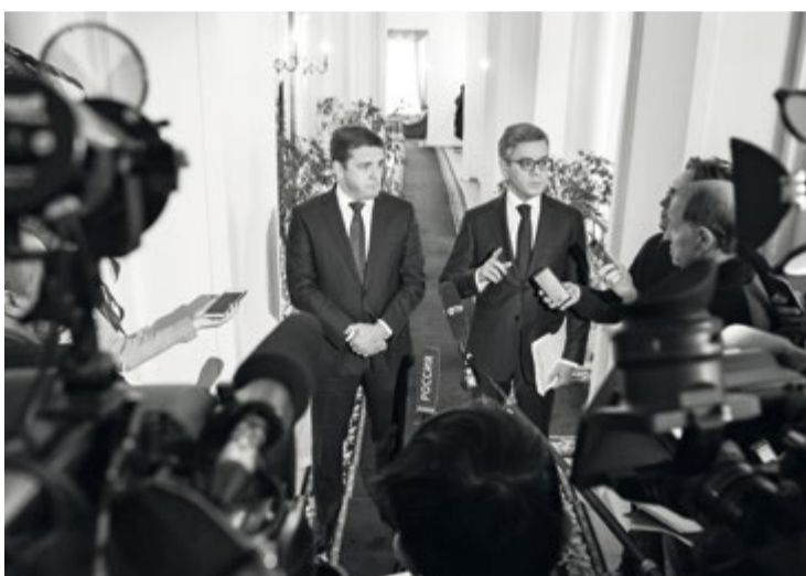
Участники Общественного совета откровенно ответили на вопросы журналистов