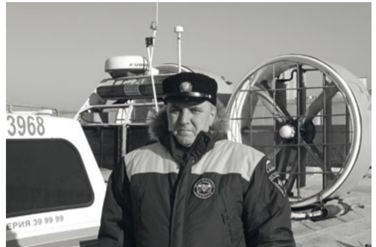
Леонид МАКОВЕЦКИЙ, главный государственный инспектор региональной ГИМС