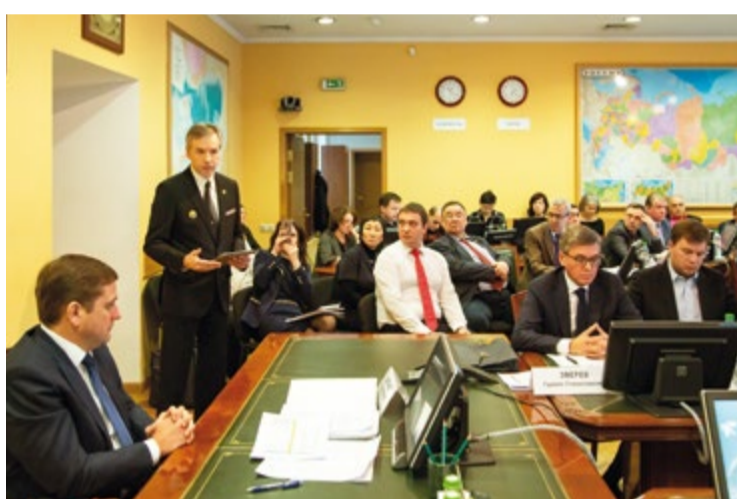
Аукционы 2000-х годов вогнали предприятия в долговые ямы на 10-15 лет