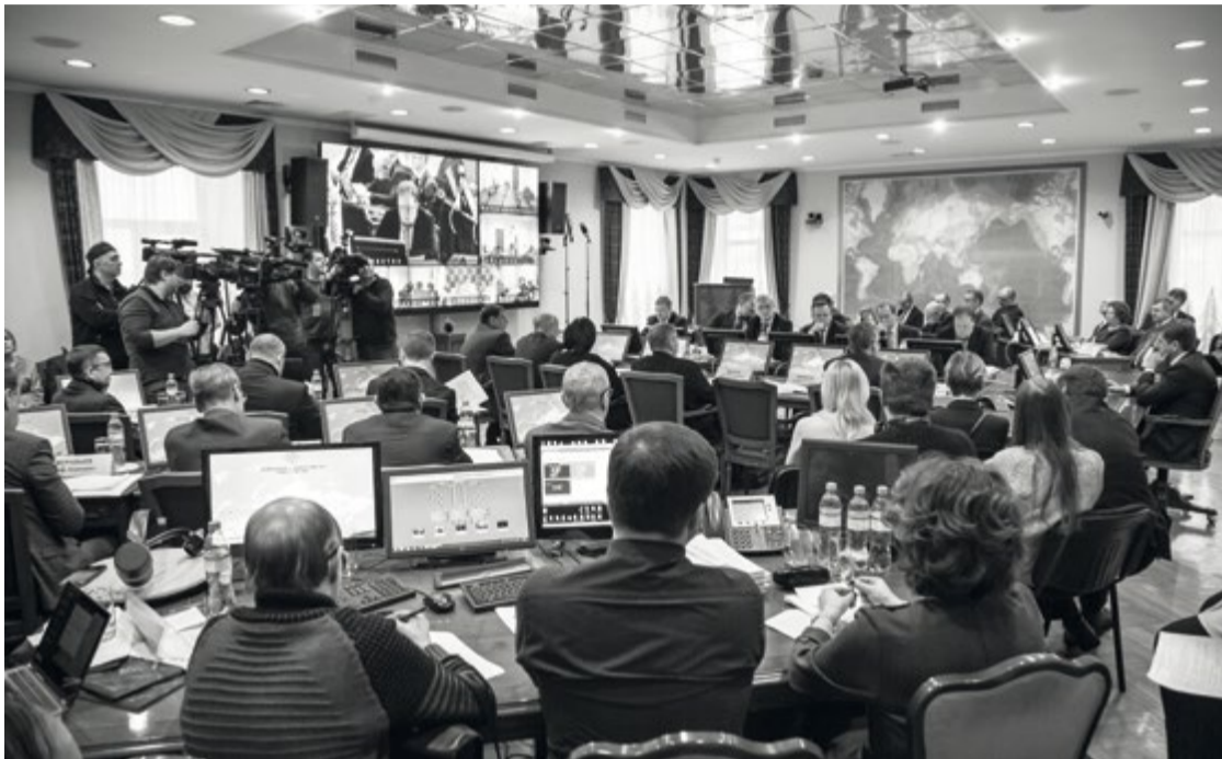
Главный и единственный вопрос на повестке дня – репутация отрасли

По словам главы рыбного ведомства, проблемой в некоторой степени остаются лишь «подфлажники», с которыми необходимо бо-