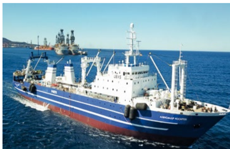
PTM-C «Александр Косарев» (Мурманский траловый флот)