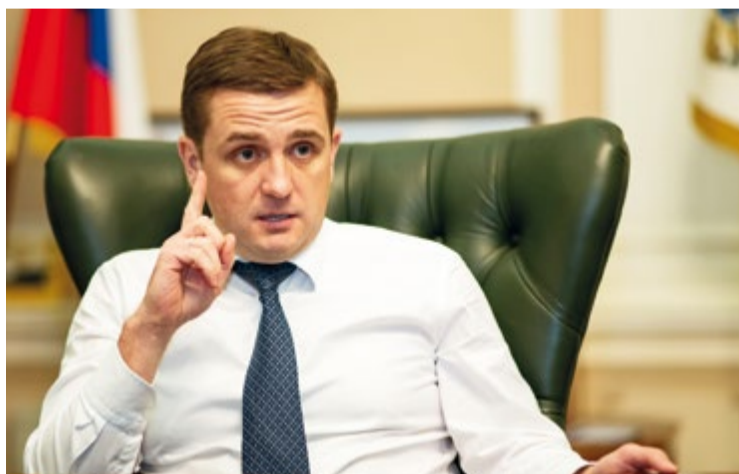
После окончания программы инвестквот, думаю, российский рыбопромысловый флот станет одним из лучших в мире

Если говорить о перспективах, то они есть, потому что мощности будут только прирастать. Мы ожидаем, что с конца 2019 года – начала 2020 года начнут работать суда, которые строятся под инвестиционные квоты. Кроме того,