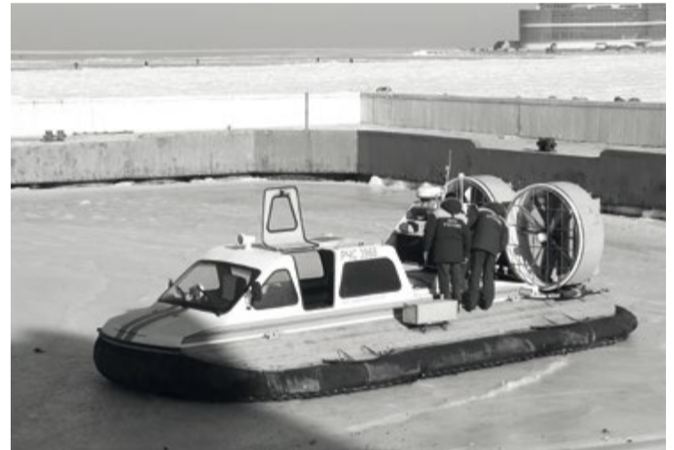
Обычно спасатели приходят на помощь рыболовам на «воздушных подушках»