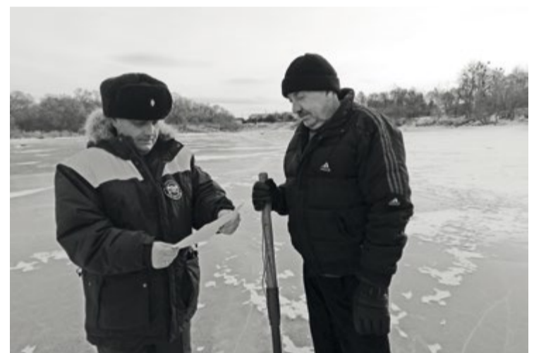
Сотрудники ГИМС регулярно проводят профилактические рейды