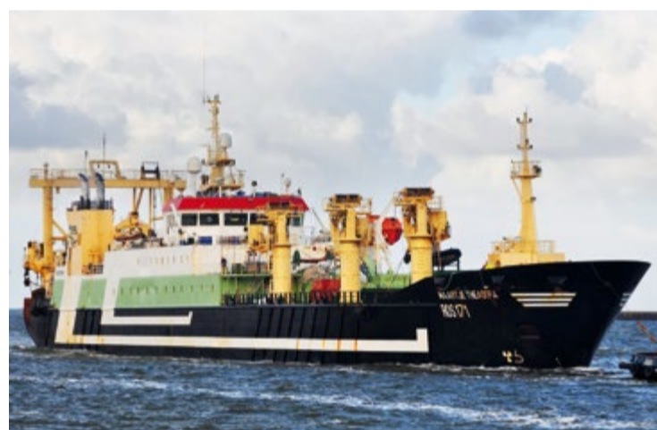
Траулер Maartje Theadora (Parlevliet & van der Plas, Нидерланды)