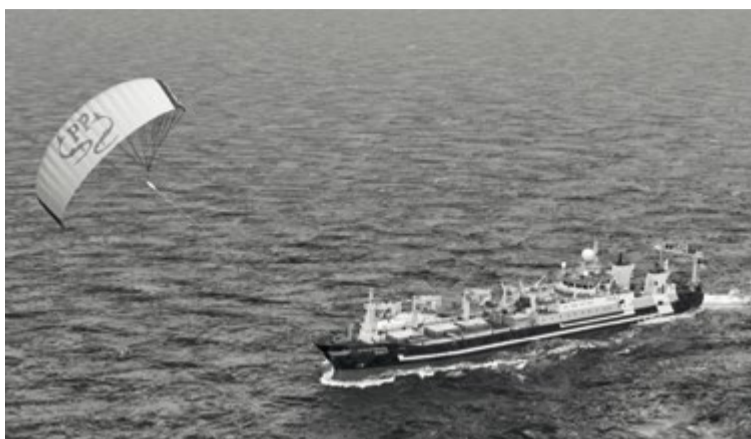
Fishing Service начал производство тяговых паропланов для экономии топлива во время длительных переходов в ЮВТО