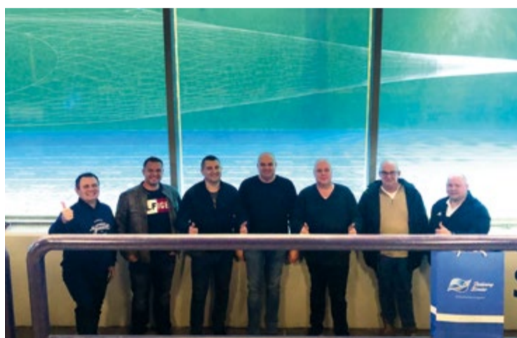
В лотке новая модель трала «Атлантика-1790»

За день работы в гидролотке было произведено более 20 тестов по перестройке тралов. И экипажи траулеров «Александр Косарев», Annelies Ilena получили огромный опыт настройки, который даже не с чем сравнивать.