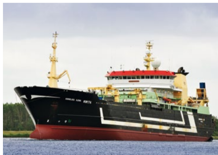
Траулер Annelies Ilena (Parlevliet & van der Plas, Нидерланды)