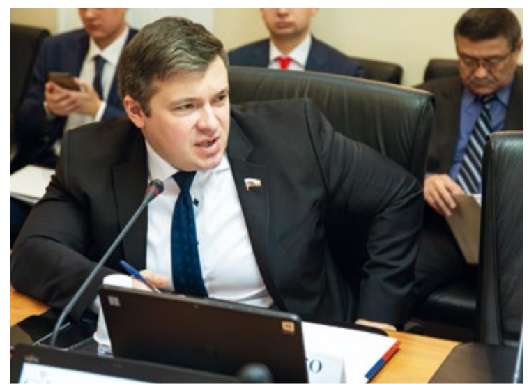
Депутат Государственной думы Андрей АНДРЕЙЧЕНКО