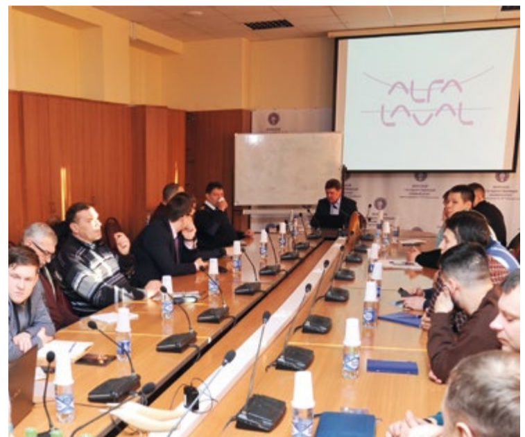
Семинар «Использование современных топлив для морских дизелей. Влияние новых стандартов и морского законодательства» прошел во Владивостоке

осадок в легком. Из-за абразивных частиц детали стачиваются за считанные часы, как от наждачной бумаги, а от выпадения шлама происходит засорение фильтров и сепараторов, заклинивание топливных насосов высокого давления и форсунок».