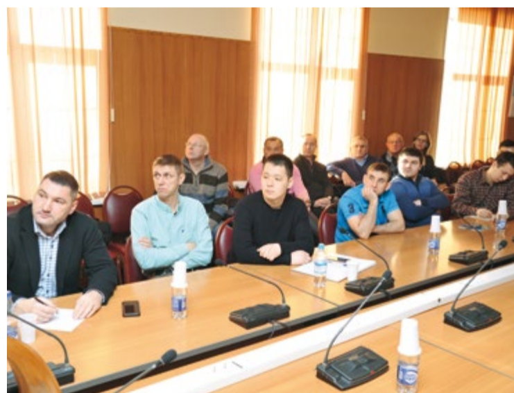
На встречу пришли профессионалы-практики

По мнению представителя «Альфы Лаваль», не стоит надеяться, что после введения новых норм произойдет массовый перевод