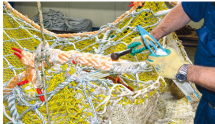
Свайка и игличка – главные инструменты тралмастера

В этом регионе у «Фишеринг Сервиса» приобретают орудия лова различных конструкций: и