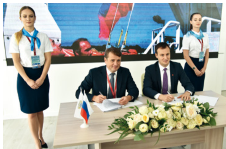
Договоры на доли инвестквот по итогам третьего этапа распределения заключили на ВЭФ

– Возможно, приведет, возможно, и нет. Надо смотреть, какие будут последствия. Нужно отметить, что мы не вбрасываем новую продукцию. По сути дела, стоит задача занять определенную нишу, возможно, получить чью-то долю на рынке.