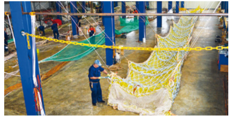
Мешок проекта 76, предназначенный для судов типа СТР-503, может использоваться с разными моделями тралов

По словам Дмитрия Федорова, уловы зависят не только от размеров и конструкции тралов, но и от характеристик флота. Наливное судно за одно траление может выловить и 800, и даже 1000 тонн. БАТМ сможет поднять максимум 150 тонн, а «голубым» супертраулерам по силам до 220 тонн. При этом максимальные объемы улова за одно траление определяются не возможностью