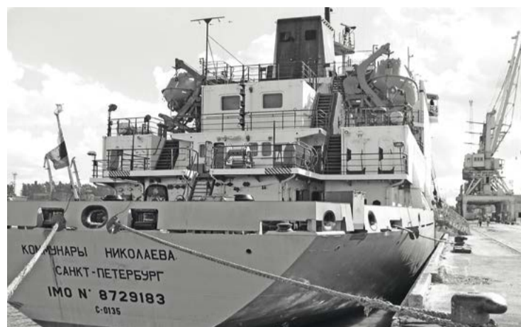
В 2011 году транспортный рефрижератор «Коммунары Николаева» с 4 725 тоннами лосося на борту вышел из порта Петропавловска-Камчатского 30 июля и Северным морским путем добрался в Санкт-Петербург 28 августа

«При этом отмечу: наращивание возможностей Северного морского пути, его активное использование в качестве внутреннего транспортного коридора выводит на первый план и задачи по развитию портовой инфраструктуры Дальнего Востока и Северо-Запада России, включая Мурманский транспортный узел. Прошу держать такую работу на контроле», – сказал президент.