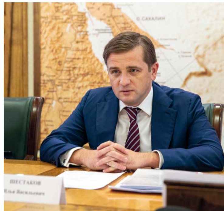
Илья ШЕСТАКОВ, заместитель министра сельского хозяйства – руководитель Росрыболовства

– Мы уже проводили в феврале заседание ДВНПС, на котором предварительно обсуждались стратегии. Они доработаны по результатам того совета, внесены определенные коррективы