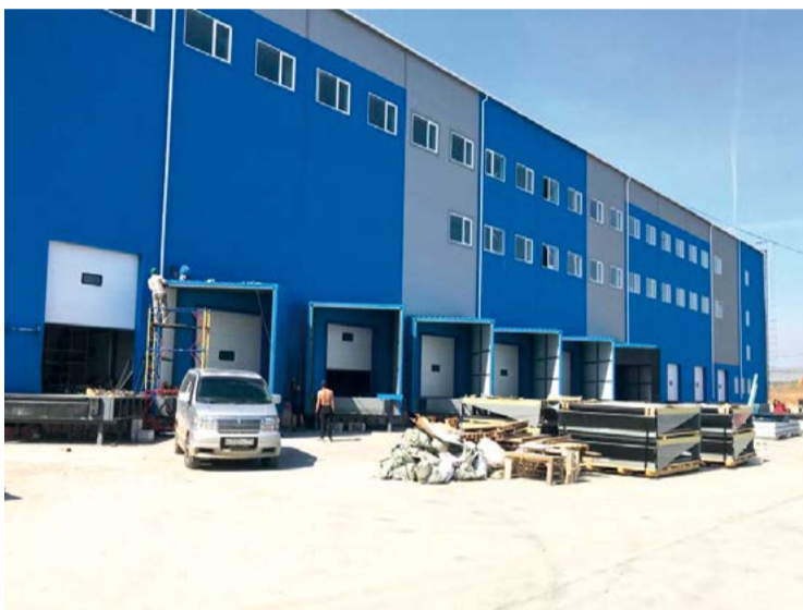
Монтаж производственно-складского рефрижераторного комплекса завершен

Холодильная установка работает на аммиаке, в местах работы людей будет использован промежуточный хладоноситель. Всего смонтировано 42 промышленных воздухоохладителя различного назначения и использования. Суммарная холодиль-