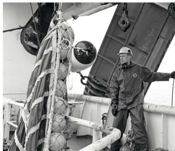
Положения отраслевого соглашения станут обязательными для каждого предприятия, входящего в Ассоциацию рыбопромышленных предприятий Сахалинской области

Также предполагаются другие виды социальной помощи сотрудникам организаций рыбного хозяйства – путевки на санаторно-курортное лечение, компенсация расходов на лечение. Предлагается выплачивать денежное вознаграждение работникам, отмеченным государственными, отраслевыми и профсоюзными наградами. Еще одна рекомендация – дополнительно страховать сотрудников на случай временной нетрудоспособности из-за болезни, травмы на производстве и профессиональных заболеваний, потери работы.