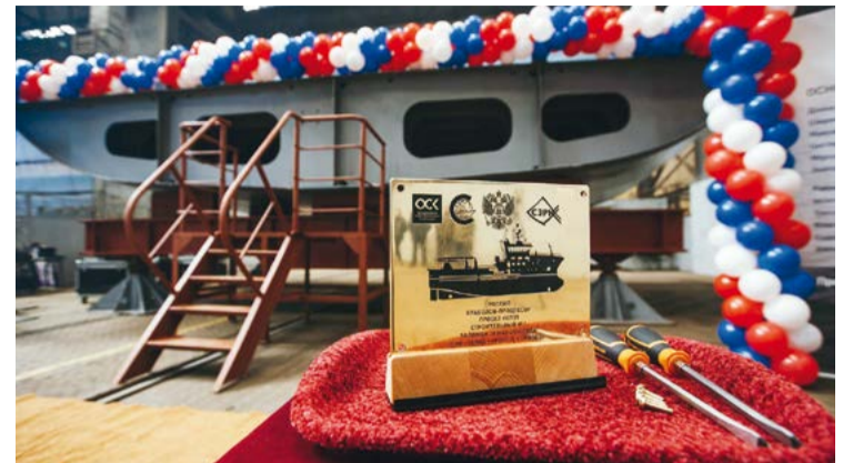
Первый крабовый из серии заказчик должен получить в 2023 г.

Такие сроки оставляют рыбакам совсем небольшой запас