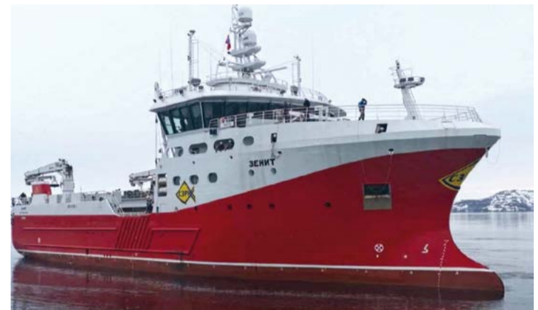
Головное судно «Зенит» уже на промысле

времени в случае задержек со строительством, с которыми столкнулись, к примеру, компании-участники программы инвестквот. «К сожалению, в нормативных документах не предусмотрено никакого продления, даже если это связано с объективными причинами. На мой взгляд, это неправильно, потому что мы опять становим-