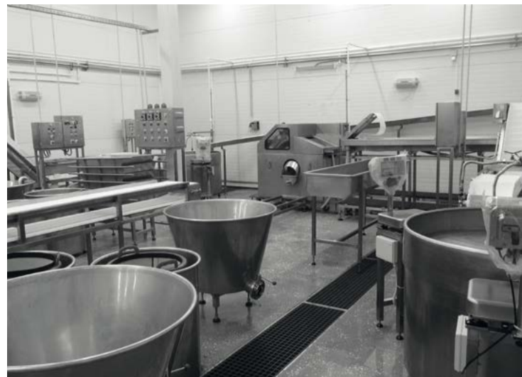
Монтаж и запуск оборудования на рыбоперерабатывающих заводах и судах грозит обернуться коллапсом в регионах