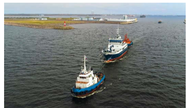
Первый краболов, построенный в России, передан заказчику

«Коллектив завода совместно с нашими специали-