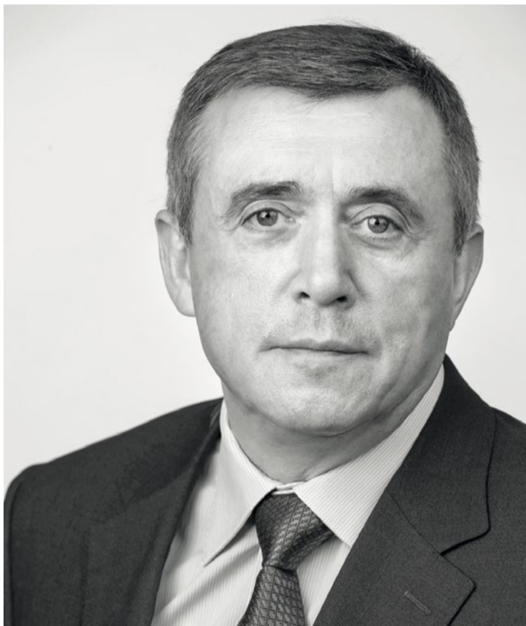
Губернатор Сахалинской области Валерий ЛИМАРЕНКО

За последние несколько лет в Сахалинской области под инвестиционные квоты построены современные рыбоперерабатывающие заводы. На острове Шикотан компания «Курильский рыбак» ввела в эксплуатацию самый крупный по объемам производства завод, где перерабатываются минтай и сельдь по инвестиционным квотам, а также треска,