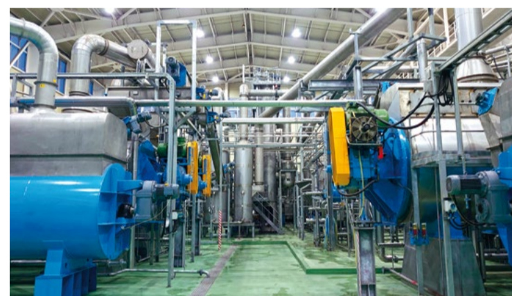
Отходы переработки идут на новый завод по выпуску рыбной муки и жира