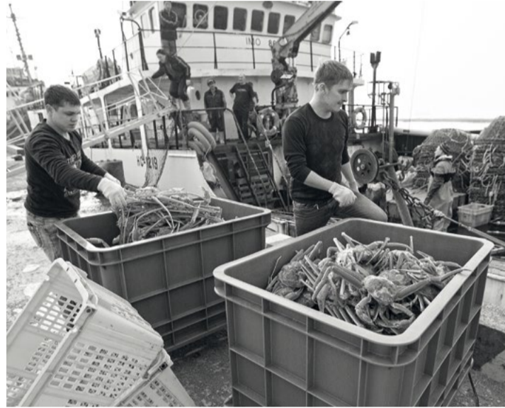
Рыбацким коллективам психологически тяжело убеждаться в том, что истинные причины происходящего с их компаниями все-таки лежат за пределами закона

Сами предприятия с выводами налоговиков и следственных органов не согласны. Как сообщает корреспондент Fishnews,