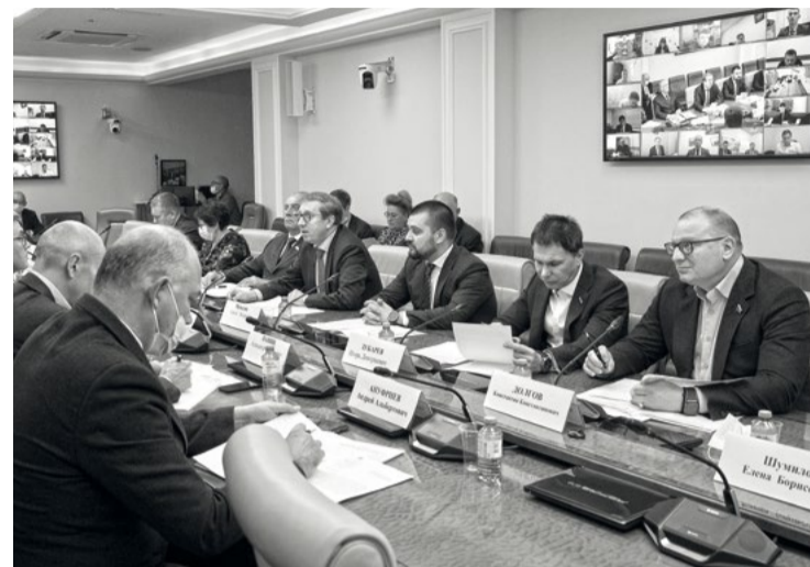
Первый этап инвестквот показал неоднозначные результаты. Градус обсуждения перспектив программы растет с каждой новой дискуссией

Правда, пока эти интересы очень похожи на желание получить антиконкурентное преимущество перед остальными рыбаками. Президент Всероссийской ассоциации рыбопромышленников (ВАРПЭ) Герман ЗВЕРЕВ обратил внимание, что государство изначально гарантировало инвесторам загрузку до половины производственных мощностей за счет инвестквот в течение 15 лет, и эти договоренности