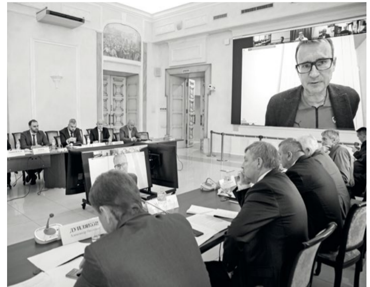
Биржевой вопрос подняли на совместном заседании общественных советов при ФАС и Росрыболовстве

С точки зрения Росрыболовства, аукционные торги рыбой и морепродуктами обеспечат ту же прозрачность и ценовые индикаторы, в которых нуждаются контролирующие ор-