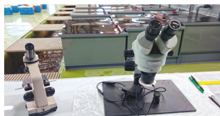
Лосось здесь не только добывают, но и воспроизводят