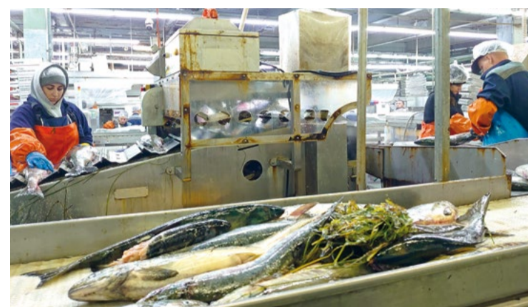
Производство в ЮКРК ведется круглый год. Сегодня в обработке – кета