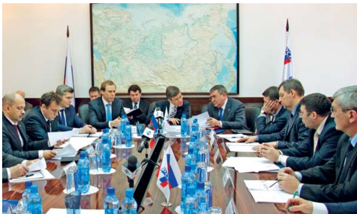
Заседание подкомиссии по рыбохозяйственному комплексу и аквакультуре Комиссии по агропромышленному комплексу РСПП

Однако все достигнутые результаты фактически перечеркнуло решение Комиссии Таможенного союза № 317 от 18 июня 2010 г. «О применении ветеринарно-санитарных мер в Таможенном союзе», которое вновь возложило функции вете-