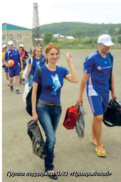
Группа поддержки ЗАО «Примрыбснаб»