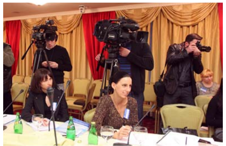
С 2009 года каждое мероприятие АДМ вызывает большой интерес СМИ. Пресс-конференция по итогам годового собрания Ассоциации

Многие задают вопрос: в чем секрет успеха Ассоциации добытчиков минтая? Всего за пять лет она вошла в «высшую лигу» российских отраслевых лоббистов, а сейчас близка к достижению аналогичной цели в мировом ры-