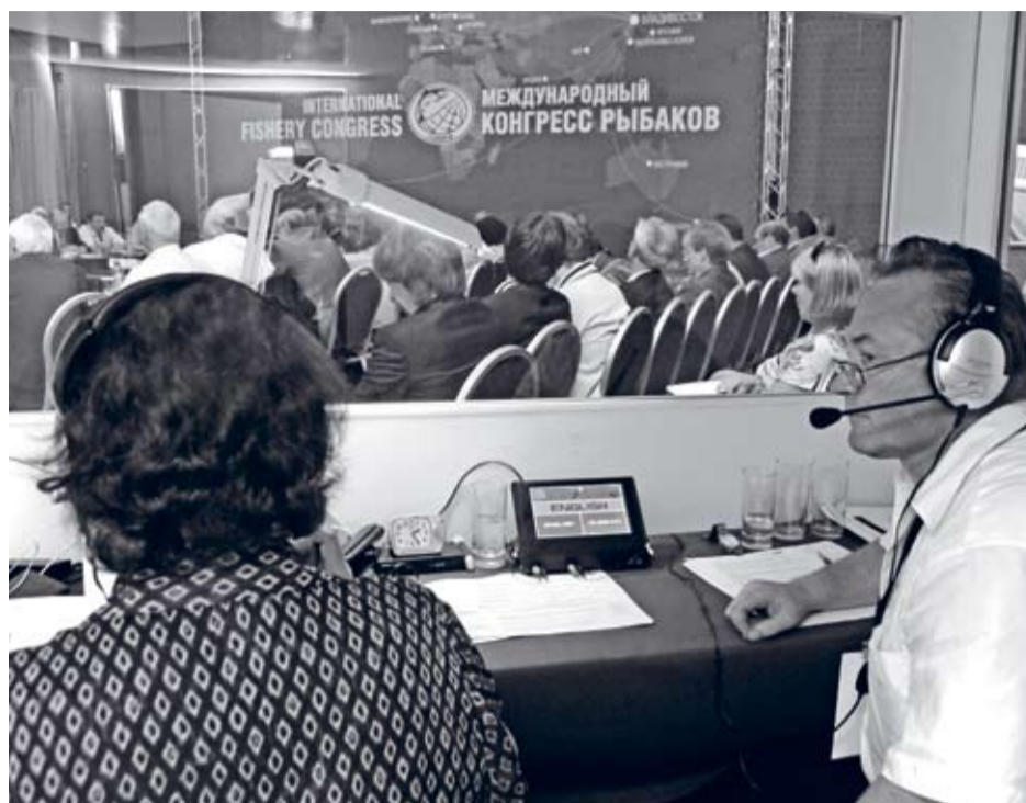
Пленарное заседание и круглые столы конгресса рыбаков синхронно идут на русском и английском языках

«к экономике лидерства и инноваций». В этом году мы уже будем говорить о модернизации рыболовства, ее целях, условиях, движущих силах – вопросах международного уровня.