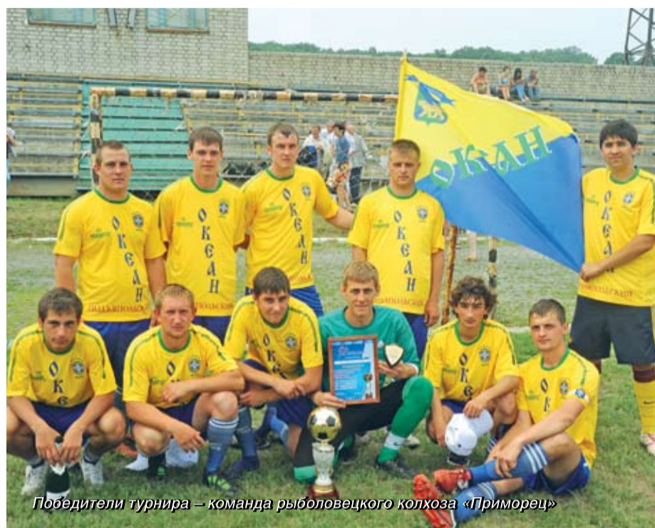
Победители турнира – команда рыболовецкого колхоза «Приморец»