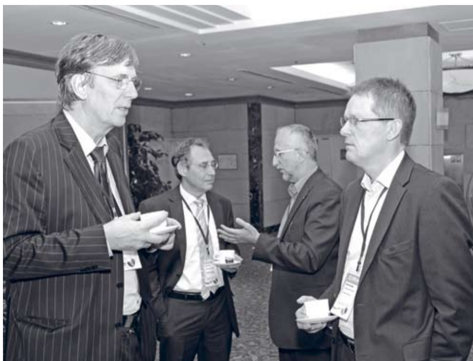
В перерывах обсуждения продолжаются