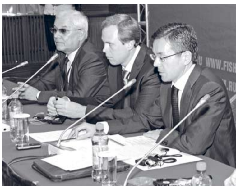
Международный конгресс рыбаков 2010 года. Круглый стол «Основные механизмы финансирования текущей и инвестиционной деятельности рыбохозяйственных предприятий»

При этом обсуждать мы будем, прежде всего, марикуль-