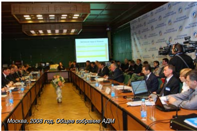
Москва, 2008 год. Общее собрание АДМ