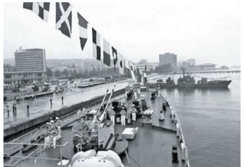
Корабли китайских ВМС с визитом дружбы в северокорейском порту Вонсан (4 августа 2011 г.)

Хэ» и фрегат «Люоянг» – 4 августа 2011 г. с визитом дружбы посетили северокорейский порт Вонсан (Фото). Китайские корабли прибыли в порт КНДР после посещения порта Владивосток для участия в церемонии празднования 315-летия Российского Флота 14 (см. фото).