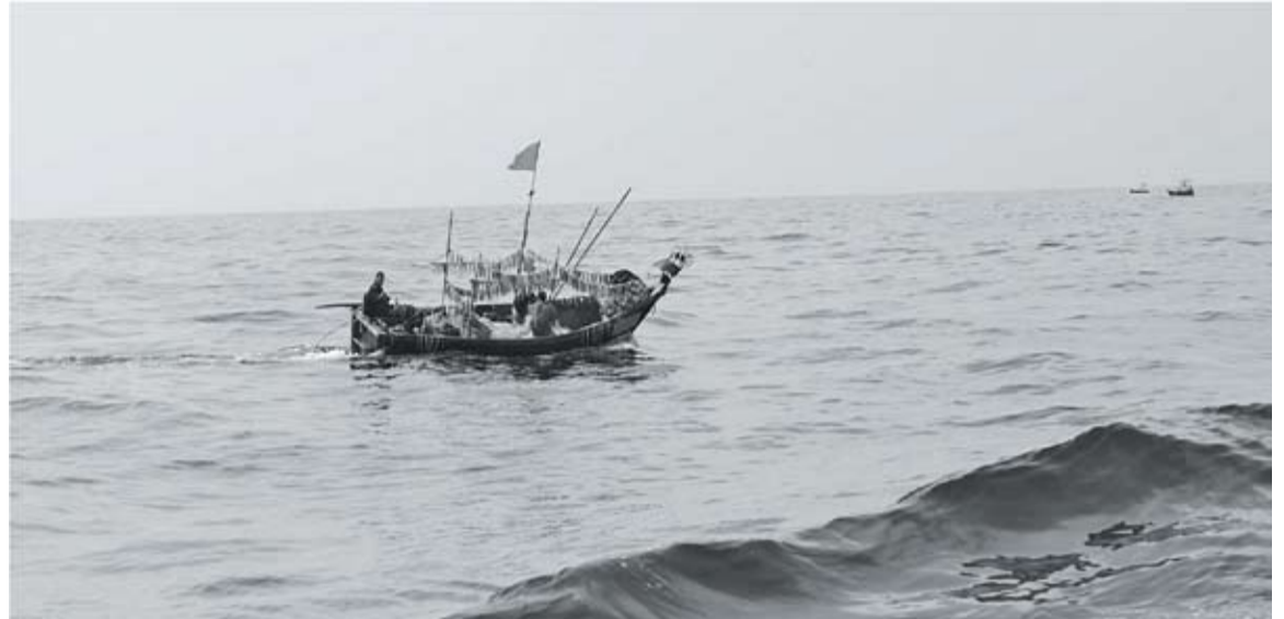
Маломерное судно неизвестной национальности под флагом КНР, ведущее незаконный промысел в ИЭЗ РФ 5.10.2011.

Таким образом, Китай установил не только экономический, но и военный контроль над северо-корейской прибрежной зоной в Японском море. И в этом Пекин весьма преуспел. Пхеньян этому мало препятствует, рассчитывая на импульс экономического развития и поддержку Китая в конфликтах КНДР с «третьими» странами: Республикой Корея, США, Японией и др. Вследствие значительного возросшего монопольного влияния Китая