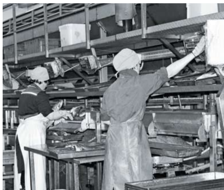
Рыбоперерабатывающая фабрика РК им. Ленина в Петропавловске-Камчатском

Очень много сложностей, особенно при доставке сырца на берег, у нас возникает из-за неотрегулированности применения на практике постановления № 560 (о многократном пересечении границы) – каждый шаг связан с таким количеством оформлений, что работать по нему сегодня очень тяжело. На той же сайре: добывающий флот у нас