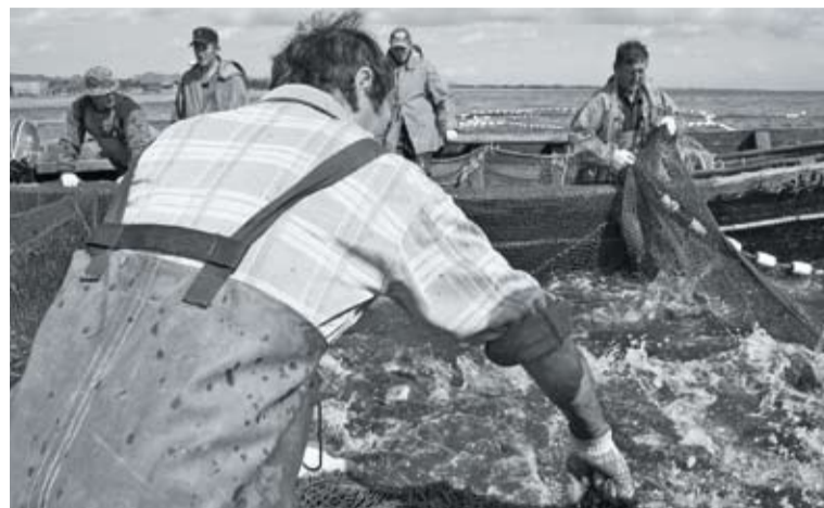
Лососевая путина Сахалинской области

Объемы вылова морского ежа у Южных Курил на протяжении ряда лет стабильны и колеблются в районе 6 тыс. тонн. Изъятие трески здесь достигло 3,2 тыс. тонн, что на 0,5 тыс. тонн больше показателя предыдущего года. Вылов других объектов