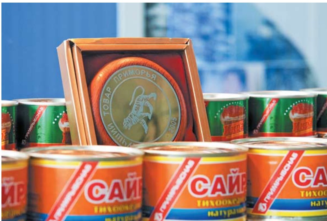
Продукция приморских производителей на Международной выставке «Экспофиш 2011»

- Значит, вопрос о продовольственной безопасности идет вразрез с теми решениями, которые были приняты по вступлению в ВТО. Мое мнение, что вступление в ВТО в части усиления импорта на российском рынке в ближайшее время сильного значения иметь не