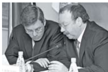
Президент Ассоциации добытчиков минтая Герман ЗВЕРЕВ и вице-губернатор Приморского края Игорь УЛЕЙСКИЙ

по проблемам подготовки и обеспечения рыбохозяйственного комплекса специалистами и рабочими кадрами.