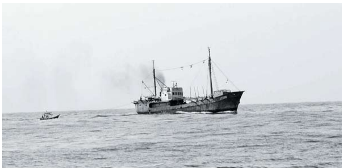
Маломерное судно неизвестной национальности в ИЭЗ РФ следует к судну-матке для сдачи незаконного улова 5.10.2011.

В 2011 году незаконная деятельность китайских судов стала настолько сильно препятствовать деятельности иностранных рыбаков, ведущих промысел на законных основаниях в российской ИЭЗ, что законопослушные иностранные рыбаки стали отказываться от ведения промысла в российских водах Японского моря. Так, в ходе 21-й сессии Российско-Корейской Комиссии по рыбному хозяйству (Республика Корея, ноябрь 2011 г.) корейская сторона сообщила, что ее суда в 2011 году в ИЭЗ России в Японском море не смогли ве-