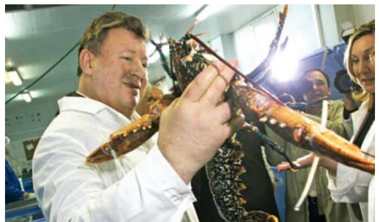
Владимир КАШИН, председатель комитета Государственной Думы по природным ресурсам, природопользованию и экологии