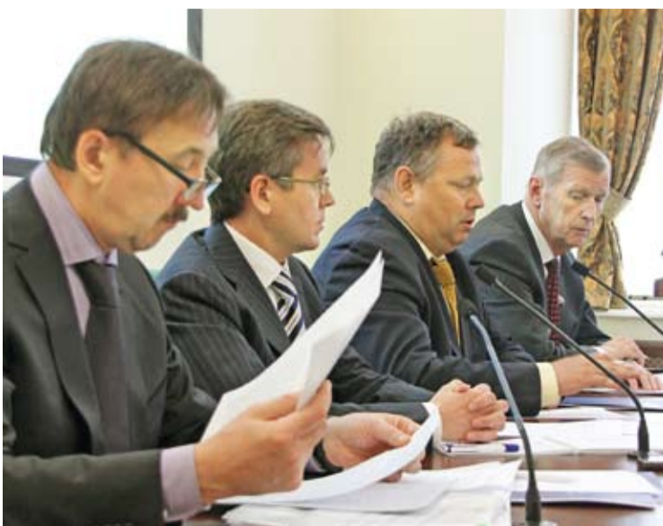
Заместитель руководителя Россельхознадзора Евгений НЕПОКЛОНОВ, председатель подкомиссии РСПП по рыбному хозяйству и аквакультуре Герман ЗВЕРЕВ, директор департамента торговых переговоров Минэкономразвития РФ Максим МЕДВЕДКОВ и председатель Комитета Совета Федерации Геннадий ГОРБУНОВ

5 марта на расширенном заседании Подкомиссии РСПП по рыбному хозяйству и аквакультуре рассмотрела вопросы адаптации рыбохозяйственного комплекса к правилам ВТО.