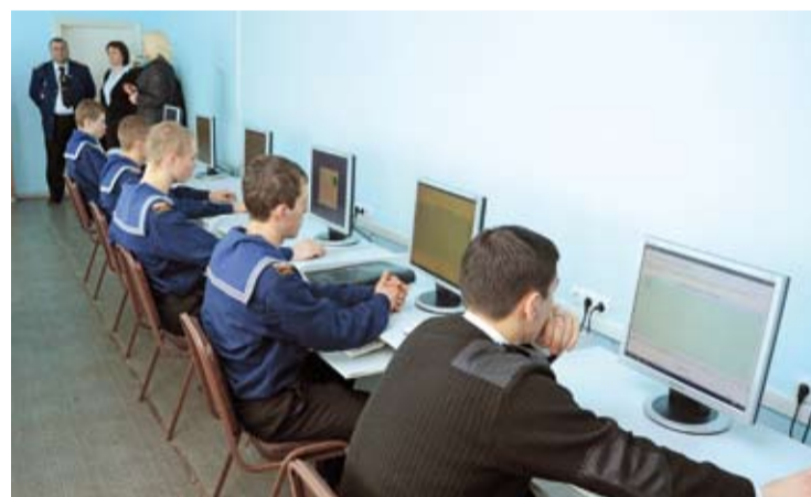
В учебном классе колледжа

Такие свидетельства (надо сказать, почти ничем не отличающиеся от подлинных) в узком кругу работодателей почему-то получили название «чапаевских дипломов». А то, что на судах время от времени выявляются подобные «чапаевцы», уже давно перестало быть чем-то из ряда вон выходящим. Мол, таковы реалии нынешнего времени, и с этим явлением пока надо мириться как с неизбежным злом. Потому-то и первые попытки ВМРК наладить контакты руководителей кадровых служб некоторых предприятий воспринимали с