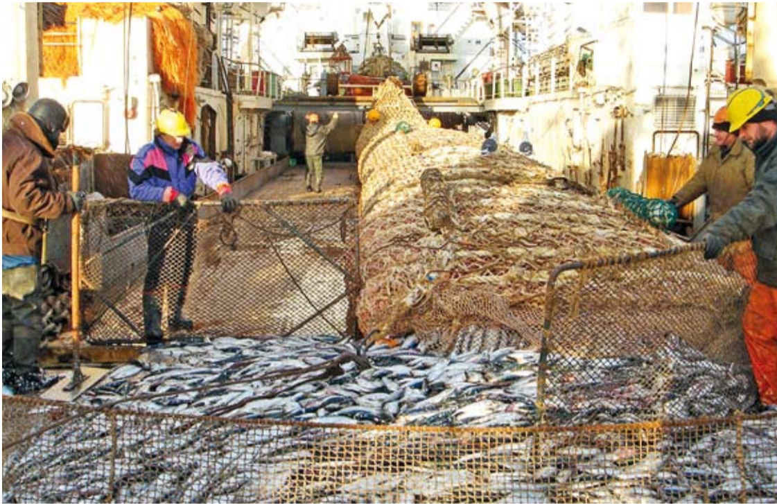
Сельдевая путина на Дальнем Востоке

Сохранение импортных и экспортных пошлин на сельдь в 2012-2013 годах, оперативная доставка рыбы с Дальнего Востока и внимание к тихоокеанской сельди со стороны трейдеров и переработчиков позволят насытить рынок «народной» рыбой, уверены рыбопромышленники.