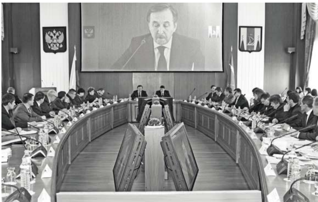
Совещание руководства Россельхознадзора с рыбаками Сахалина в марте 2012 года

Суть разбирательств досконально прописана в судебных постановлениях различ-