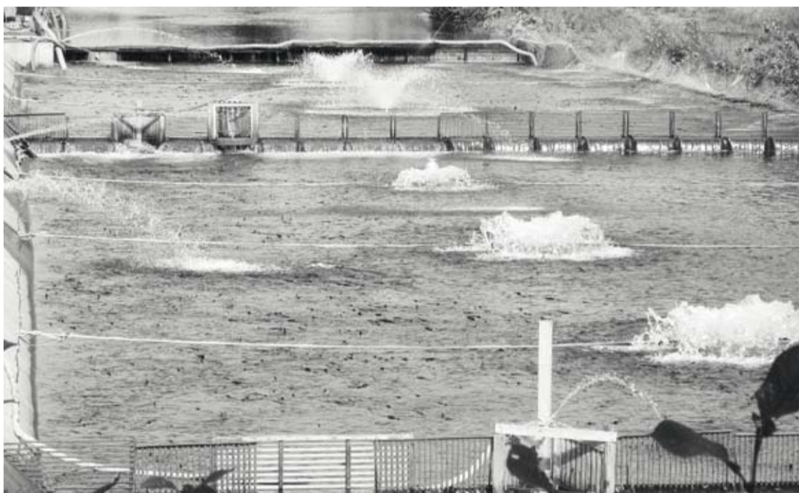
Забойка Лесного лососевого рыбодобывающего завода компании «Тунайча»

Национальная концепция лососеводства необходима! В условиях постоянно растущего населения Земли – по оценкам ООН, к 2050 г. оно составит около 10 млрд. человек – аквакультура, в том числе и лососеводство, становится одним из основных гарантов продовольственной безопасности. По данным Про-