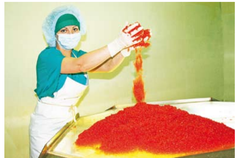
32 тонны качественной икры ушло на корм скоту

Вернемся еще раз к судебным материалам. «Согласно ст. 16 ГК РФ убытки, причиненные гражданину или юридическому лицу в результате незаконных действий (бездействия) государственных органов, органов местного самоуправления или должностных лиц этих органов, в том числе издания не соответствующего закону или иному правовому акту акта государственного органа или органа местного самоуправления, подлежат возмещению Российской Федерацией, соответствующим субъектом Российской Федерации или муниципальным образованием. В соответствии со ст. 1071 ГК РФ в случаях, когда в соответствии с настоящим Кодексом или другими законами причиненный вред подлежит возмещению за счет