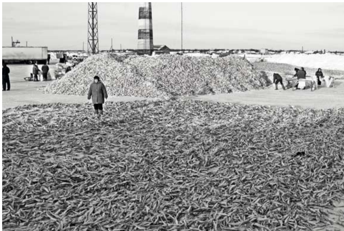
Сахалинские уловы готовят к отправке на материк

«Мы неоднократно встречались с представителями компании, проводили переговоры в Мадриде, посещали их логистические комплексы. Конечно, это очень технологичный бизнес, удивительно правильно и красиво организован. Но в первую очередь это блестящий пример организации государством муниципально-частного пар-