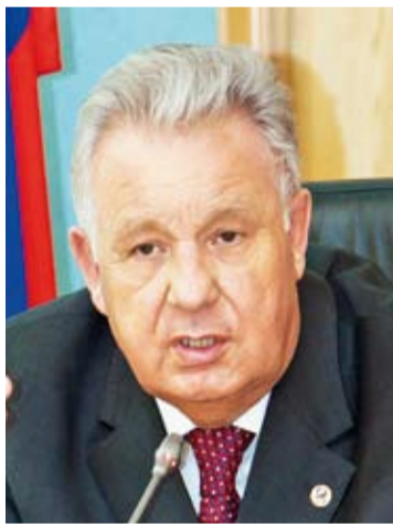
Министр Виктор ИШАЕВ

Утверждение ОДУ для Дальневосточного бассейна, распределение квот, а также порядок и условия аукционов по продаже долей квот планируется осуществлять через Минвостокразвития.