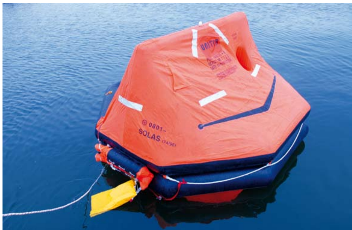
Продукция «Wilhelmsen Ships Service»

посещающих иностранные порты. На территории России с клиентами работает 4 офиса, расположенных в Санкт-Петербурге, Мурманске, Новороссийске и Владивостоке, и 2 склада, осуществляющих снабжение в западных и восточных регионах страны.