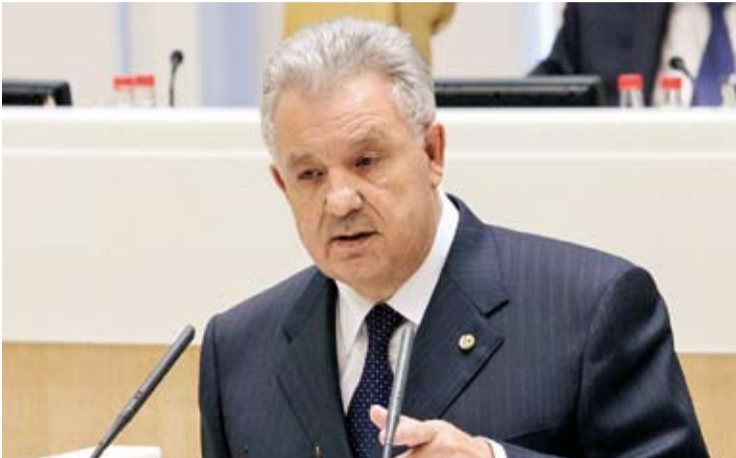
Министр Виктор ИШАЕВ