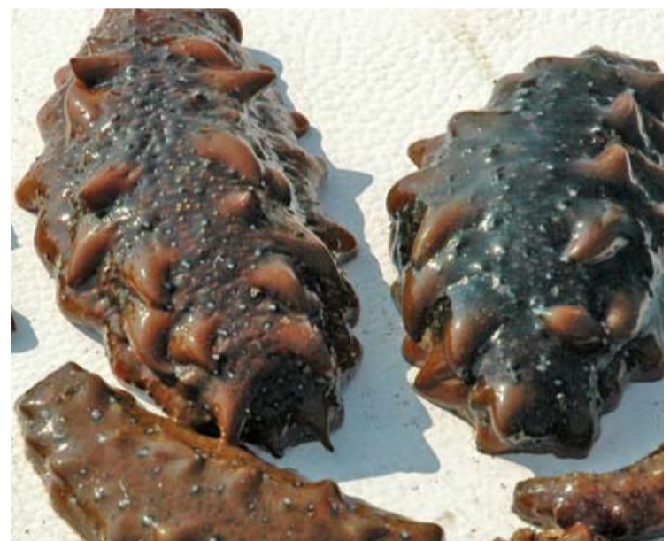
Морской гребешок и трепанг – объекты аквакультуры Дальнего Востока

Центр, в силу крайнего дефицита материальных и людских ресурсов оставляя без должного внимания обширный перечень научных проблем, которые должна решать сегодня рыбохозяйственная наука в сфере аквакультуры.