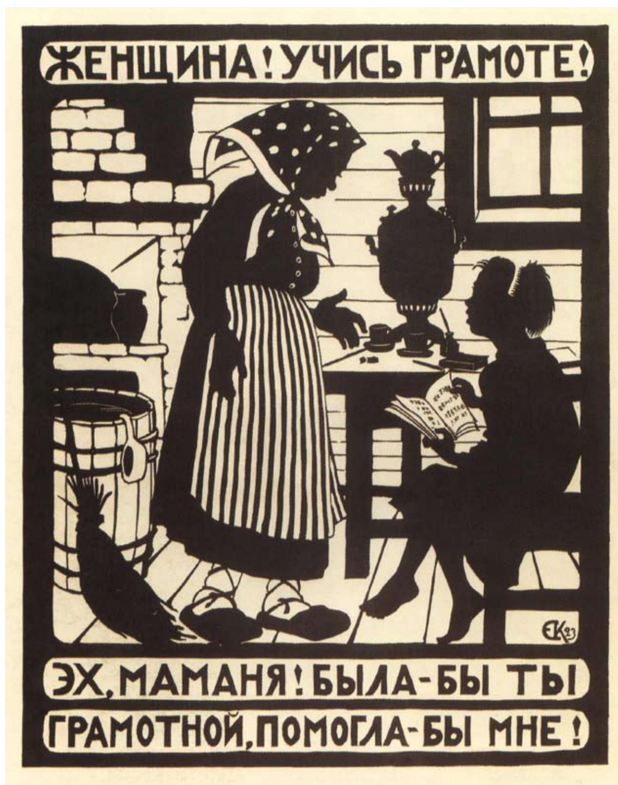
Е. Кругликова. 1923 г.