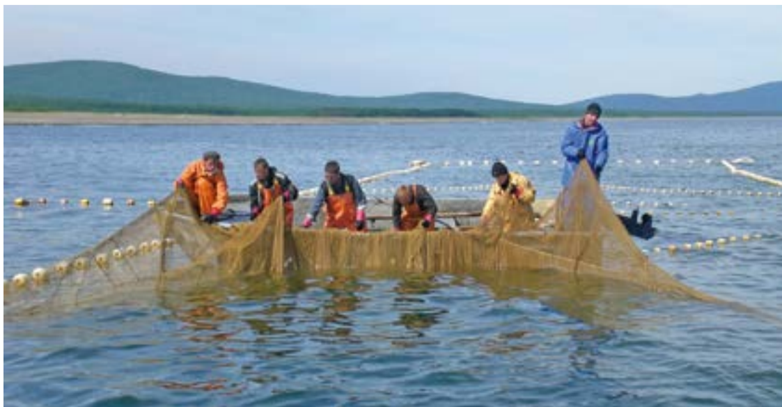
Рыбаки ООО «Тройка» на неводе