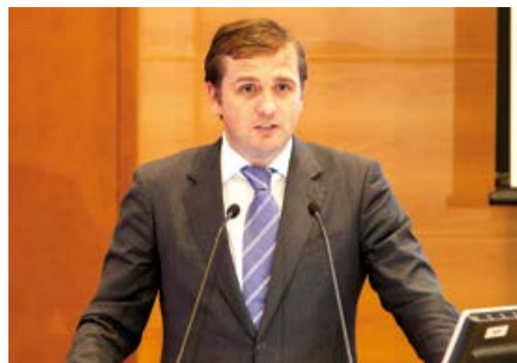
Илья ШЕСТАКОВ, руководитель Федерального агентства по рыболовству