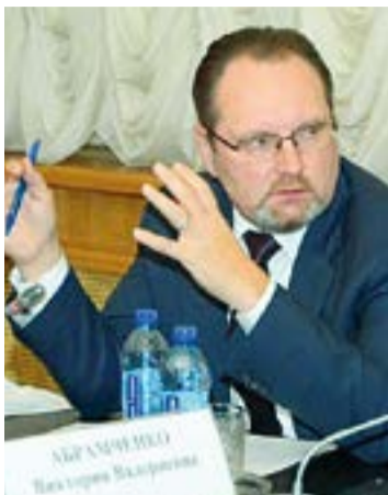
Игорь МАНЫЛОВ, первый заместитель министра сельского хозяйства

В качестве ориентира Росрыболовство выбрало технические характеристики судна – длина не более 36 метров или оснащение живорыбными емкостями, что должно гарантировать безусловную доставку уловов на берег и либо их дальнейшую переработку, либо реализацию в свежем и охлажденном виде населению. Для указанных судов будут запрещены перегрузы и переработка на борту, со-