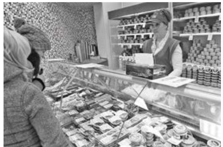
Основное правило для подобных торговых точек — минимальная торговая наценка. Рыба и морепродукты должны быть доступны для всего населения, уверены в правительстве Камчатского края

Отметим, в настоящее время в крае уже создана розничная сеть магазинов, которые принадлежат камчатским рыбохозяйственным компаниям. Активно на местном рынке ра-