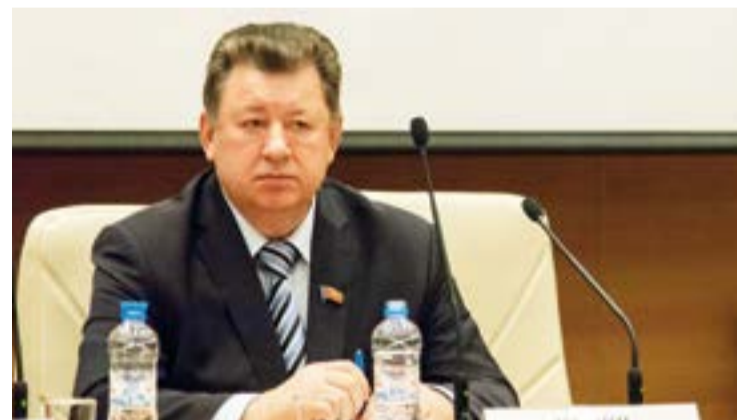
Владимир КАШИН, председатель комитета ГД по природным ресурсам, природопользованию и экологии